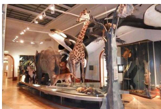
Museum für Naturkunde Magdeburg