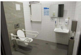
1. OG: Öffentliches WC für Menschen mit Behinderung