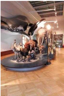
Ausstellungsraum/ Raum 1 / 1. OG