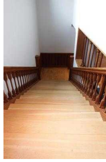
1. OG: Ausstellungsräume