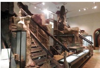
Ausstellungsraum/ Raum 2 / 1. OG