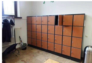
Garderobe / Foyer / EG

Die Garderobe ist offen, am Zugang zum Kaiser Otto Saal gelegen. Sie besteht aus Tresen, Garderobenhaken und Schließfächern. Sie wird im normalen Museumsbetrieb nicht bewirtschaftet.