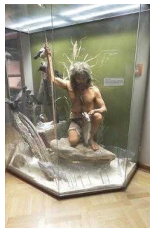
1. OG: Ausstellungsräume