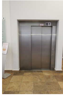
Aufzug zum 1. OG