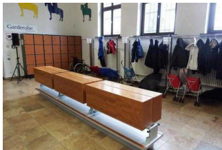
Garderobe / Foyer / EG