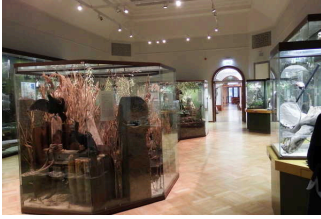
Ausstellungsraum/ Raum 3 / 1. OG

Informationen werden schriftlich vermittelt.