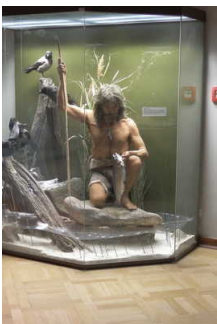
Ausstellungsraum/ Raum 5 / 1. OG

Informationen werden schriftlich vermittelt.