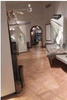
Ausstellungsraum/ Sonderausstellung / 1. OG