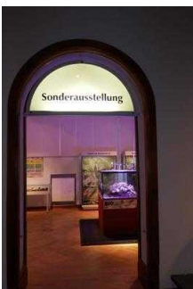
Ausstellungsraum/ Sonderausstellung 1. OG

Informationen werden schriftlich vermittelt.