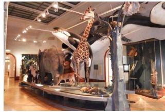
Ausstellungsraum/ Raum 1 / 1. OG