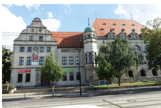
Bild von Museum für Naturkunde im Kulturhistorischen Museum Magdeburg