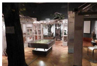
Museum für Naturkunde Magdeburg