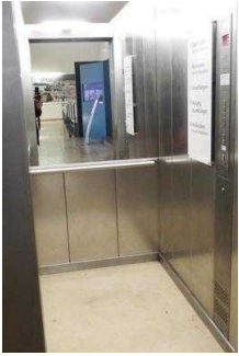
Aufzug zum 1. OG