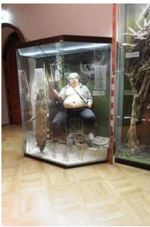
Ausstellungsraum/ Raum 4 / 1. OG

Informationen werden schriftlich vermittelt.