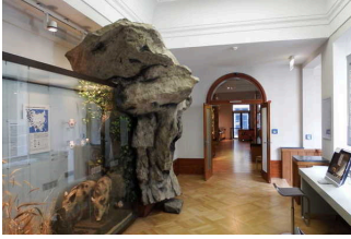
Ausstellungsraum/ Raum 6 / 1. OG

Informationen werden schriftlich vermittelt.