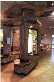
Ausstellungsraum/ Raum 8 / 1. OG

Informationen werden schriftlich vermittelt.