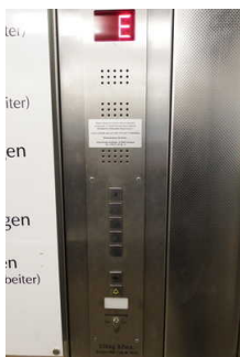
Aufzug zum 1. OG

Ein abgehender Notruf im Aufzug wird akustisch bestätigt, z.B. durch eine Gegensprechanlage.