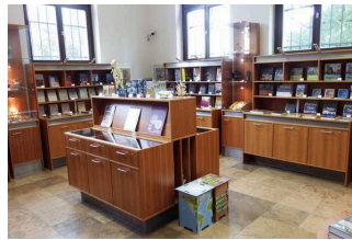
Museumsshop / EG

Anmerkungen für den Gast: Der Shop befindet sich unmittelbar neben der Kasse.