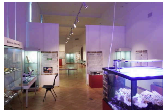
Ausstellungsraum/ Sonderausstellung/ 1. OG