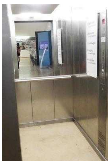
Aufzug zum 1. OG