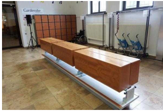
EG: Museumsshop und Garderobe