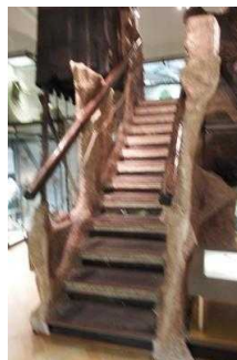
Ausstellungsraum/ Raum 2 / 1. OG

Informationen werden schriftlich vermittelt.