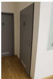
Öffentliches WC / Tür