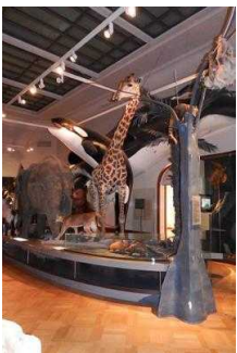
1. OG: Ausstellungsräume