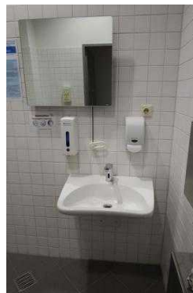
1. OG: Öffentliches WC für Menschen mit Behinderung