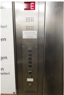
Aufzug zum 1. OG

Ein abgehender Notruf im Aufzug wird akustisch bestätigt, z.B. durch eine Gegensprechanlage.