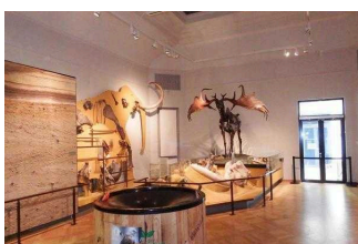
Museum für Naturkunde Magdeburg