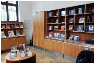
Museumsshop / EG