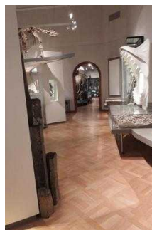
1. OG: Eingang ins Museum für Naturkunde