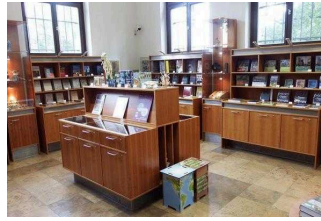
EG: Museumsshop und Garderobe