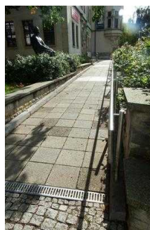
Rampe am Museum für Naturkunde Magdeburg