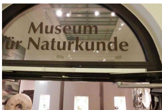
1. OG: Eingang ins Museum für Naturkunde