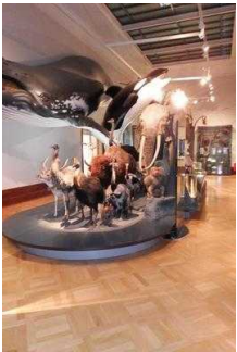
1. OG: Ausstellungsräume