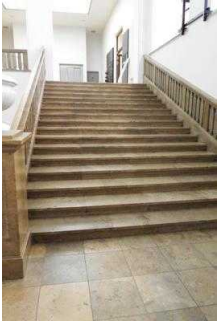
1. OG: Ausstellungsräume