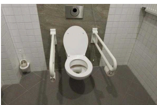
1. OG: Öffentliches WC für Menschen mit Behinderung