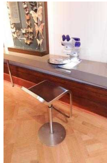
1. OG: Ausstellungsräume