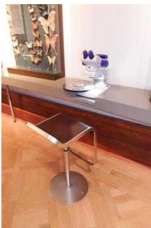
Ausstellungsraum/ Raum 1 / 1. OG

Informationen werden schriftlich vermittelt.