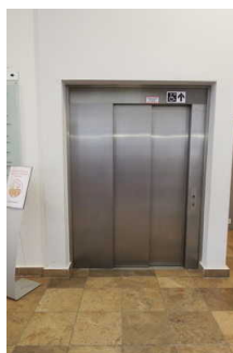
Aufzug zum 1. OG