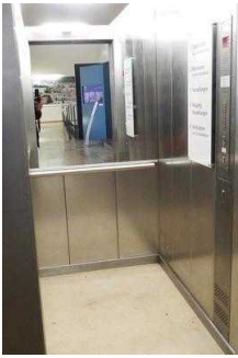
1. OG: Ausstellungsräume