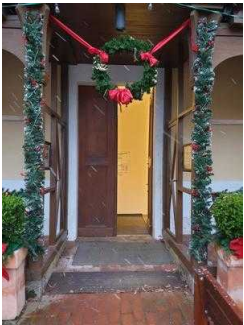
Eingang zur Gartenreich Information (Kirchhofseite)