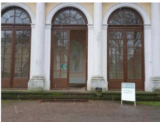
Eingang zur Gartenreich Information (Schlossseite)