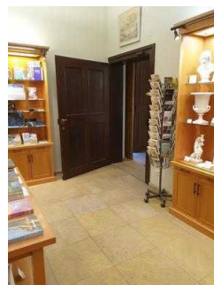
Kassentresen in der Gartenreich Information