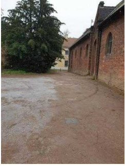
Eingang zur Gartenreich Information (Kirchhofseite)