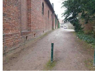
Eingang zur Gartenreich Information (Kirchhofseite)