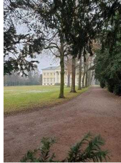
Eingang zur Gartenreich Information (Schlossseite)