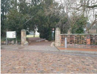
Eingang zur Gartenreich Information (Schlossseite)