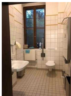
Öffentliches WC für Menschen mit Behinderung