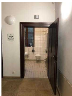
Öffentliches WC für Menschen mit Behinderung