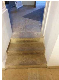
Eingang zur Gartenreich Information (Schlossseite)