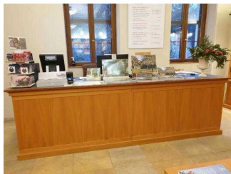
Tresen in der Gartenreich Information