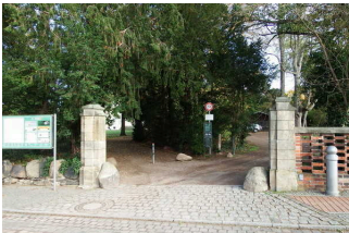
Parkeingang an der Kirchgasse

Anmerkungen für den Gast: Der Eingang des Parkes an der Kirchgasse ist nicht besonders gekennzeichnet, aber aus der Umgebung herausragend und nicht zu verfehlen.