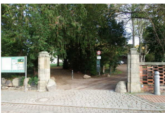
Parkeingang an der Kirchgasse

Anmerkungen für den Gast: Der Eingang des Parkes an der Kirchgasse ist nicht besonders gekennzeichnet, aber aus der Umgebung herausragend und nicht zu verfehlen.