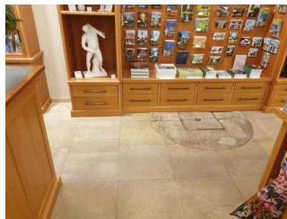
Tresen in der Gartenreich Information