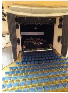
Saal (Blick von Balkon aus)