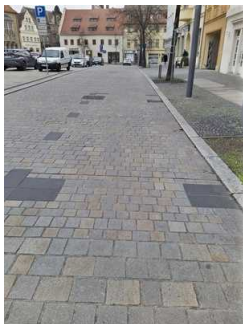
Stellplatz für Menschen mit Behinderung