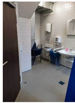
Öffentliches WC (Blick von WC-Tür zu Waschbecken)