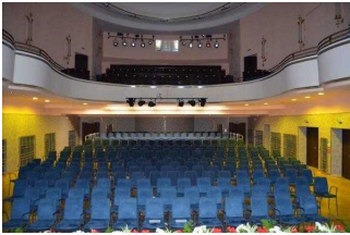
Saal (Blick von Bühne in den Saal)