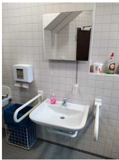
Öffentliches WC (Waschbecken)