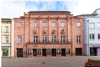
Theater Zeitz im Capitol