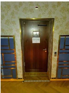
Öffentliches WC (Tür)