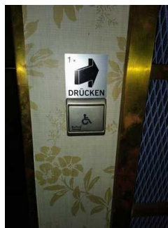
Öffentliches WC (Türöffner)