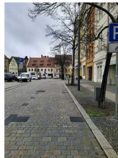
Stellplatz für Menschen mit Behinderung