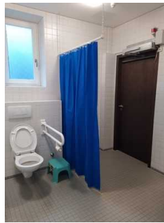
Öffentliches WC (Blick von Waschbecken zu WC-Tür)