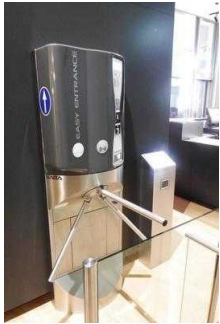
Kassenautomat vor dem WC