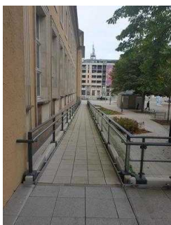
Tourist Information im Dommuseum Ottonianum Magdeburg