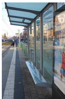
Straßenbahnhaltestelle "Domplatz/ Volksbank"