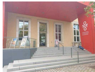
Tourist Information im Dommuseum Ottonianum Magdeburg