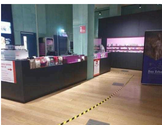
Counter / Ticketschalter