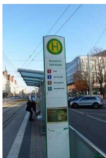
Straßenbahnhaltestelle "Domplatz/ Volksbank"