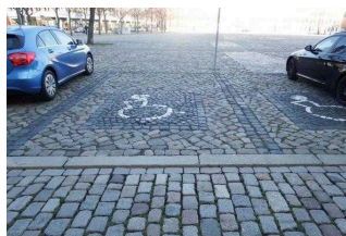
Parkplatz für Menschen mit Behinderungen vor dem Dom