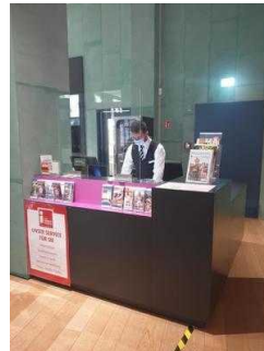
Counter / Ticketschalter