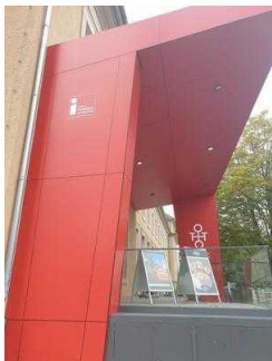
Tourist Information im Dommuseum Ottonianum Magdeburg