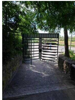
Blick von innen auf den Parkplatz