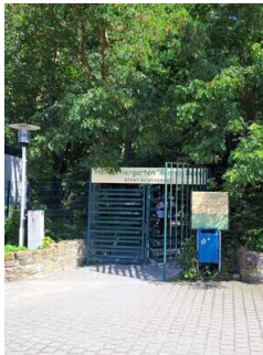
Eingang zum Heimattiergarten mit Drehkreuz