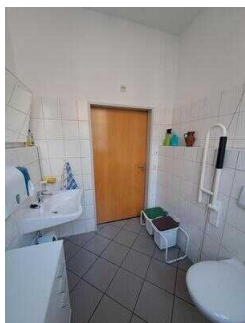
Öffentliches WC für Menschen mit Behinderung in der Tourist-Information