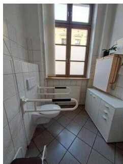
Öffentliches WC für Menschen mit Behinderung in der Tourist-Information