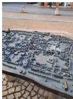
Informationen zum Stadtrundgang