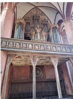
Stopp 2: Stadt- und Ratskirche St. Marien