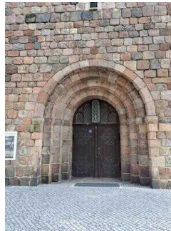
Stopp 4: Kirche St. Jacobi