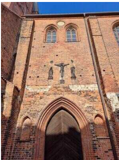
Stopp 2: Stadt- und Ratskirche St. Marien