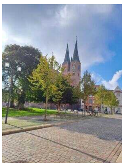
Vom Winkelmannplatz aus hat man einen sehr schönen Blick auf den Chor der Marienkirche und auf ihre 84 Meter hohen Türme, deren Helme 1987/91 eine neue