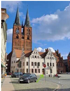
Stopp 1: Marktplatz mit Rathaus