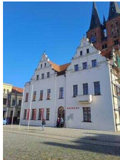
Stopp 1: Marktplatz mit Rathaus