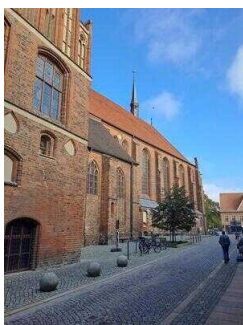
Stadt- und Ratskirche St. Marien