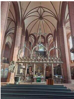
Stopp 2: Stadt- und Ratskirche St. Marien