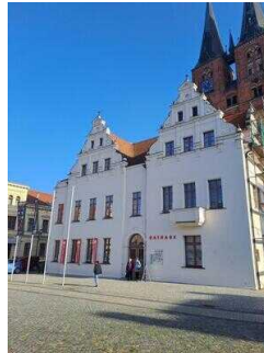
Rathaus mit Tourist-Information