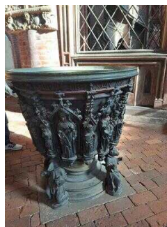
Stopp 2: Stadt- und Ratskirche St. Marien