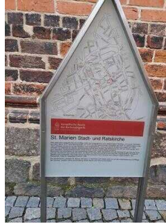
Stopp 2: Stadt- und Ratskirche St. Marien