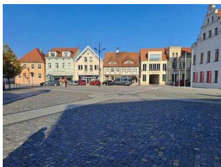
Stopp 1: Marktplatz mit Rathaus