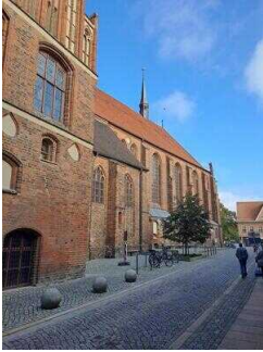
Stopp 2: Stadt- und Ratskirche St. Marien