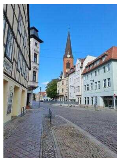
Breite Straße mit Blick auf die Jakobikirche