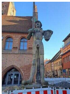
Stopp 1: Marktplatz mit Rathaus und Roland