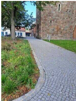
Stopp 4: Kirche St. Jacobi