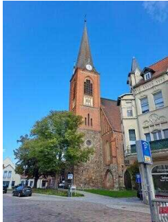
Stopp 4: Kirche St. Jacobi