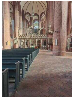
Stopp 2: Stadt- und Ratskirche St. Marien