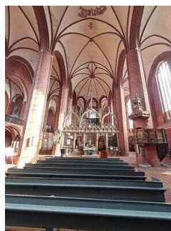
Stadt- und Ratskirche St. Marien