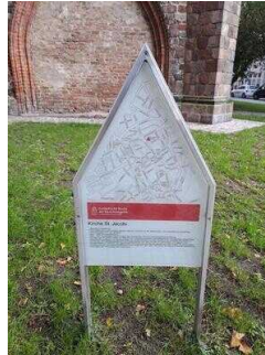
Stopp 4: Kirche St. Jacobi