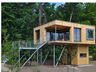
Baumwipfelresort "Lug ins Land" – Baumwipfelhaus Westerklippen Loft