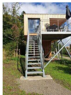
Treppe zum Eingang