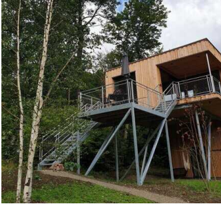
2 Terrassen am Haus