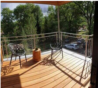
Terrasse 2 am Eingang