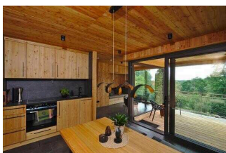
Eingang mit Blick auf die überdachte Terrasse, Wohn- und Küchenbereich