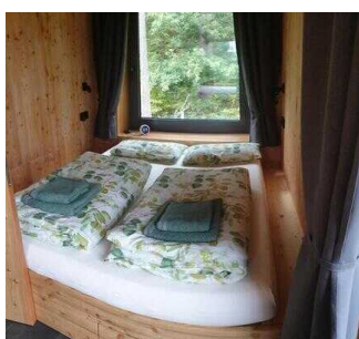
Bett links im Raum