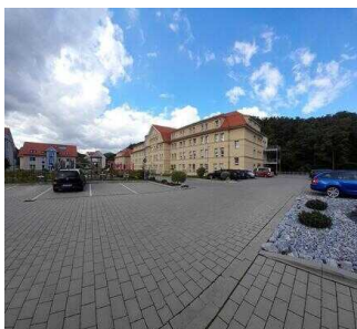
Café Argenta "GenussMomente" Wernigerode