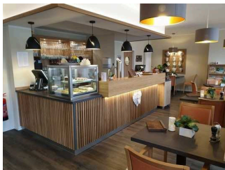
Café Argenta "GenussMomente" Wernigerode