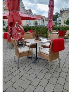
Terrasse am Café