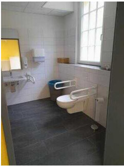
WC im UG