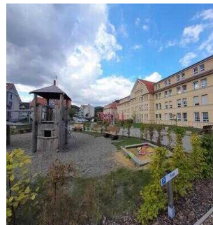
Café Argenta "GenussMomente" Wernigerode