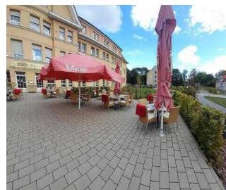
Café Argenta "GenussMomente" Wernigerode