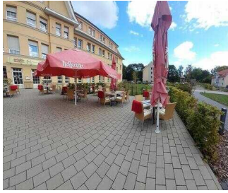
Terrasse am Café