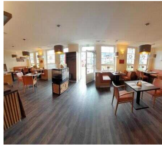
Café Argenta "GenussMomente" Wernigerode