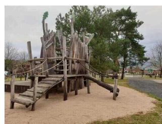
Das Waldhaus am Bergwitzsee