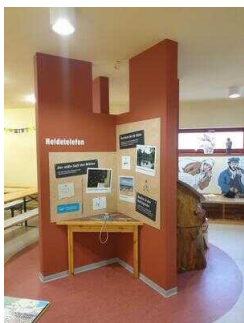
Ausstellungsraum mit Tür 1