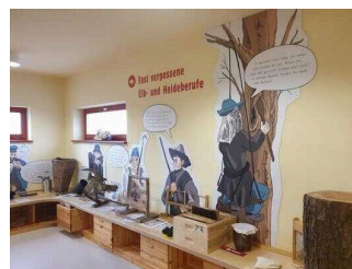
Das Waldhaus am Bergwitzsee