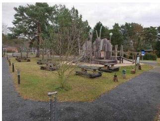
Das Waldhaus am Bergwitzsee