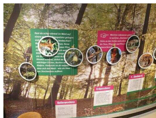
Ausstellungsraum mit Tür 1