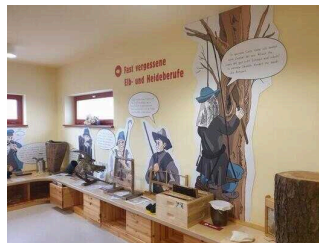
Ausstellungsraum mit Tür 1