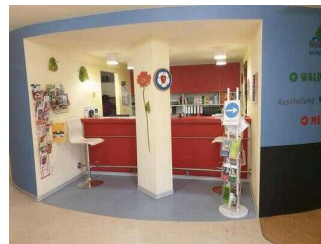
Das Waldhaus am Bergwitzsee