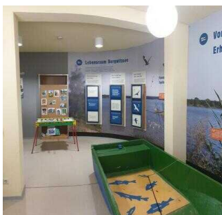
Das Waldhaus am Bergwitzsee