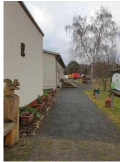
Weg zum Eingang