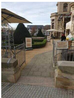
Eingang zum Genussgarten und Eiscafé