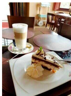
Eiscafé „eisheimisch“ im Ständehaus Merseburg