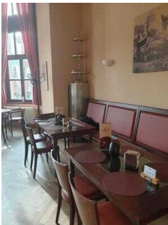
Gastraum 1 mit Eistheke