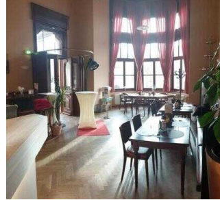
Gastraum 1 mit Eistheke