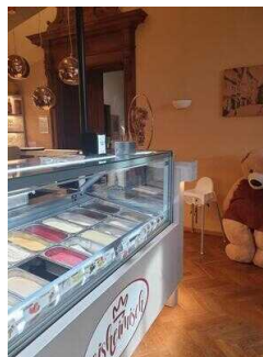
Eiscafé „eisheimisch“ im Ständehaus Merseburg