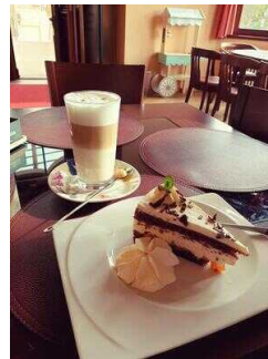
Gastraum 1 mit Eistheke