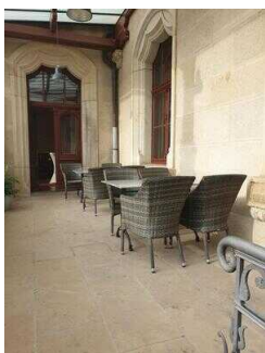
Terrasse vor dem Eingang zum Eiscafé