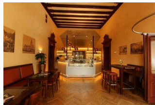
Eiscafé „eisheimisch“ im Ständehaus Merseburg