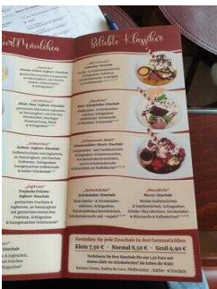
Gastraum 1 mit Eistheke