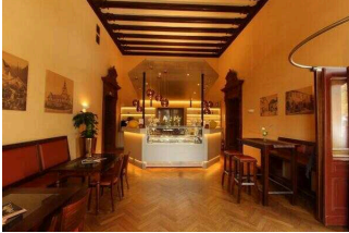
Gastraum 1 mit Eistheke