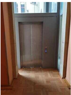
Ein-/Ausstieg im EG zum Eiscafé