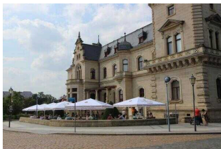
Eiscafé „eisheimisch“ im Ständehaus Merseburg