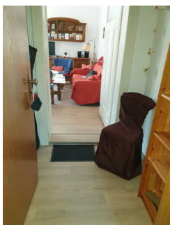
Blick durch den Flur ins Wohnzimmer