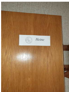
Eingang in die Ferienwohnung Heine