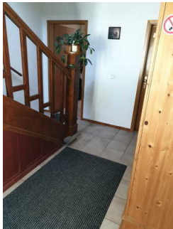
Eingang in die Ferienwohnung Heine