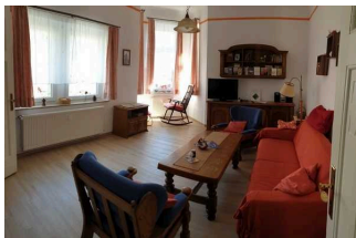
Friedegerns Ferienwohnungen – Fewo Heine