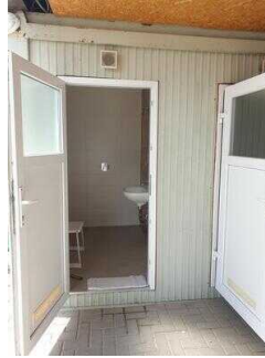
Große Dusche in der Nähe der Rezeption/Kasse