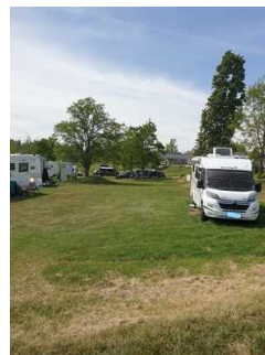
Geiseltalsee Camp Mücheln