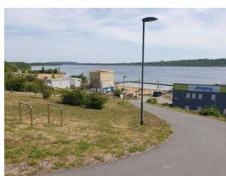
Straße zum öffentlichen Strandbereich