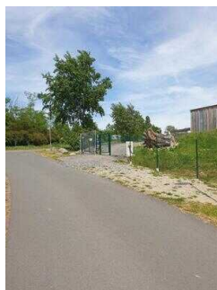
Straße zum öffentlichen Strandbereich