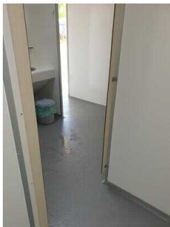
Tür zur Dusche