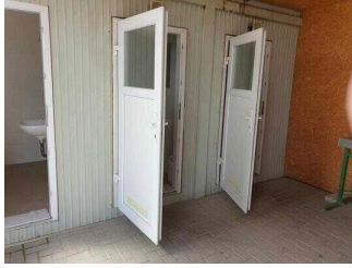
Große Dusche in der Nähe der Rezeption/Kasse