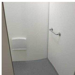
Haltegriff und Duschkocker in der Dusche