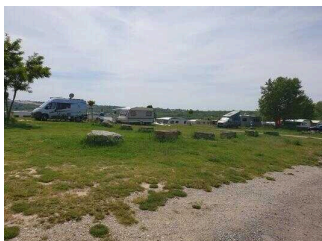
Geiseltalsee Camp Mücheln