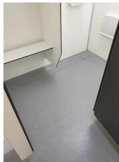
Umkleide innerhalb der Duschkabine