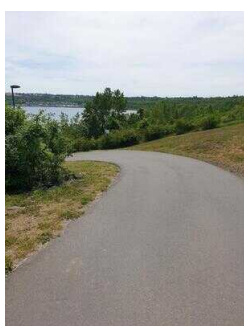
Straße zum öffentlichen Strandbereich