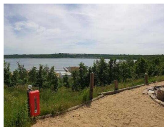
Blick auf den See