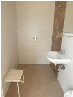
Große Dusche in der Nähe der Rezeption/Kasse