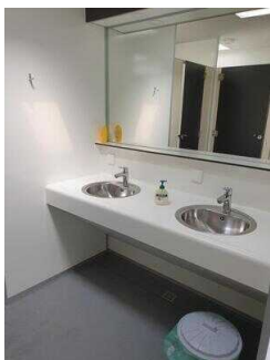
Waschbecken im Innenbereich