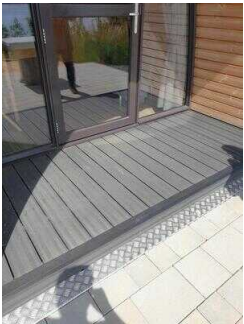
Stufe am Eingang