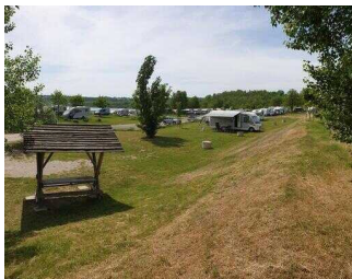
Geiseltalsee Camp Mücheln