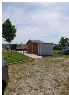
ein weiteres Sanitärgebäude auf dem Gelände