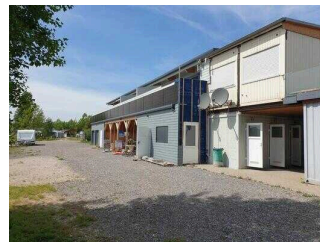
Weg zur Rezeption