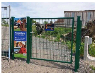
Tor zwischen Stellplatzgelände und Strand