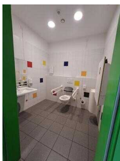
EG: Öffentliches WC für Menschen mit Behinderung