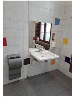
1. OG: Öffentliches WC