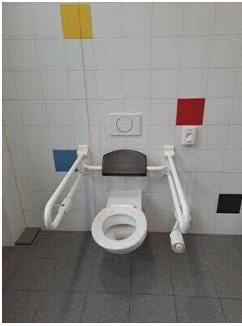
1. OG: Öffentliches WC