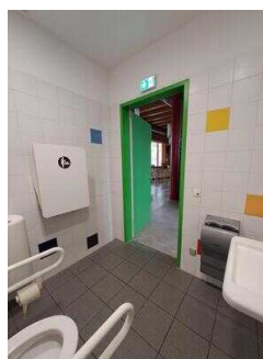
EG: Öffentliches WC für Menschen mit Behinderung