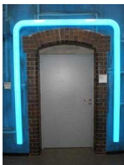
EG: Domschatzzimmer Tür