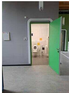
EG: Öffentliches WC für Menschen mit Behinderung