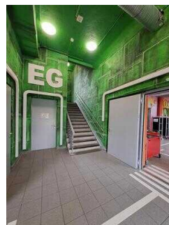
Treppenhaus mit kontrastreichen Stufen, beidseitigem Handlauf, Infos in Brailleschrift an den Handläufen