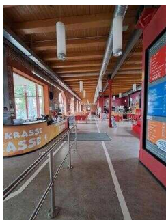
Eingangsbereich mit Cafeteria, Garderobe und WC