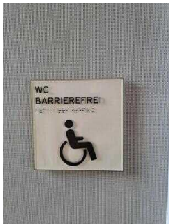
EG: Öffentliches WC für Menschen mit Behinderung