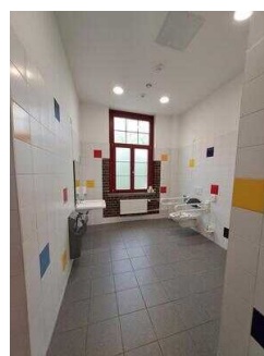
1. OG: Öffentliches WC