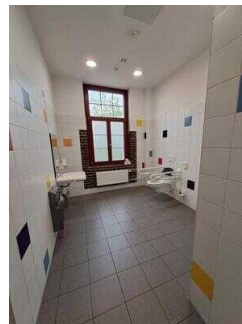
2. OG: Öffentliches WC