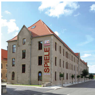
HaWoGe-Spiele- Magazin Halberstadt