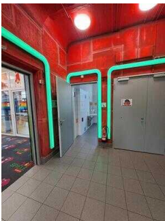
Zugang vom Treppenhaus aus