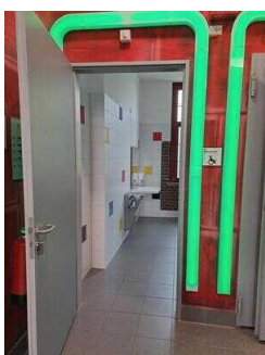
1. OG: Öffentliches WC