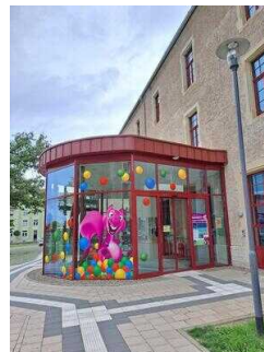
HaWoGe-Spiele- Magazin Halberstadt