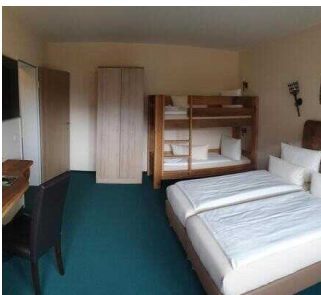
2. OG: Zimmer 209 (Schlafraum 2 groß) Familien- Appartement