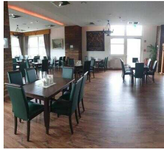
EG: Burg-Café (Zugang über Restaurant Burghof)