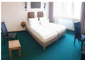
2. OG: Zimmer 201