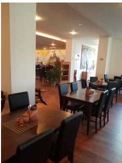
EG: Restaurant Burghof