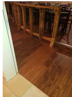
schmaler Durchgang am Eingang