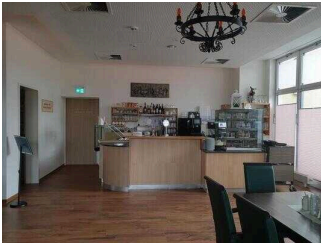
EG: Burg-Café (Zugang über Restaurant Burghof)