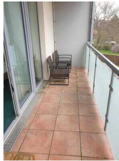
2. OG: Barrierefrei konzipiertes Zimmer 221