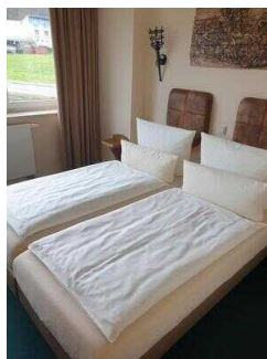
2. OG: Zimmer 209 (Schlafräum 1) Familien- Appartement