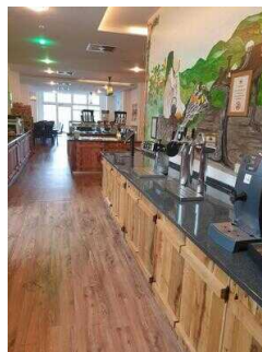
EG: Buffetts im Restaurant Burghof