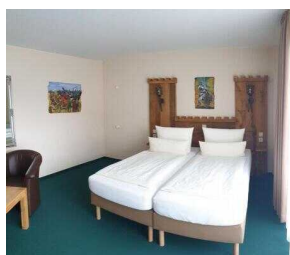
2. OG: Barrierefrei konzipiertes Zimmer 221