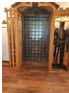
1. UG: Raubritterbar