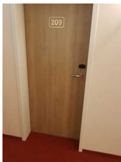
Zimmer 209 (Schlafräum 1) Familien- Appartement