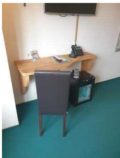
2. OG: Zimmer 201