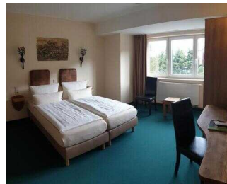
2. OG: Zimmer 209 (Schlafraum 2 groß) Familien- Appartement