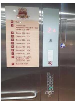
Aufzug EG – 10. OG