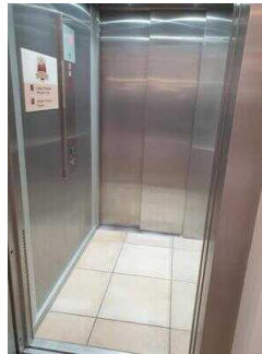
Aufzug EG – UG