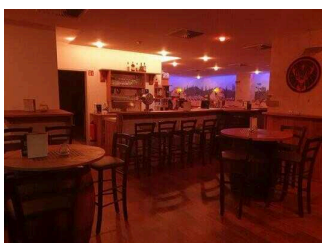
UG: Bar Excalibur