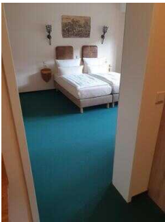
2. OG: Zimmer 209 (Schlafraum 2 groß) Familien- Appartement