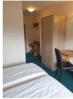
2. OG: Zimmer 209 (Schlafraum 1) Familien- Appartement