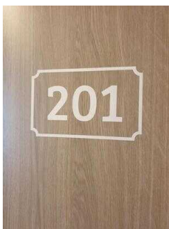
2. OG: Zimmer 201