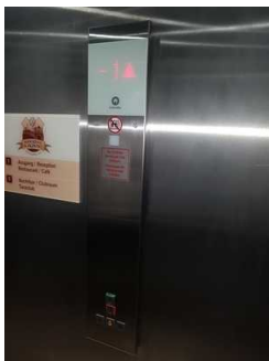
Aufzug EG- UG