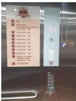
Aufzug EG – 10. OG