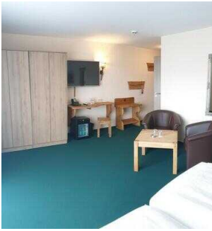
2. OG: Barrierefrei konzipiertes Zimmer 221