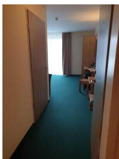
2. OG: Barrierefrei konzipiertes Zimmer 221