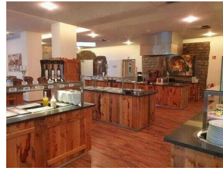
EG: Buffetts im Restaurant Burghof