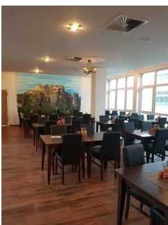
EG: Restaurant Burghof