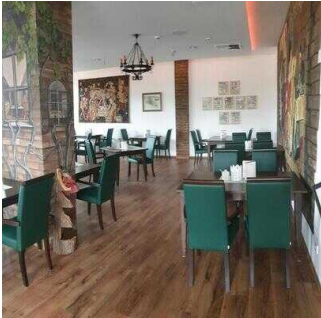
EG: Burg-Café (Zugang über Restaurant Burghof)