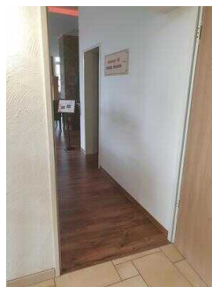
EG: Burg-Café (Zugang über Restaurant Burghof)