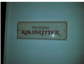
1. UG: Raubritterbar