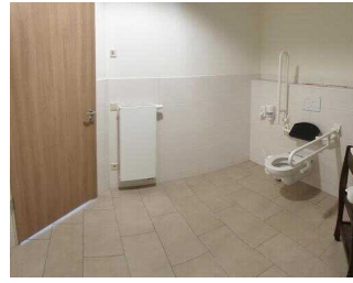
EG: Öffentliches WC für Menschen mit Behinderung im Eingangsbereich