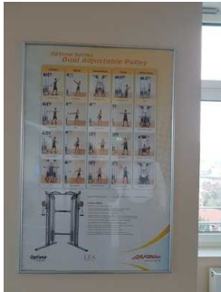
9. OG: Fitnessgerät für Rollstuhlfahrer