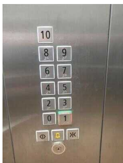
Aufzug EG – 10. OG