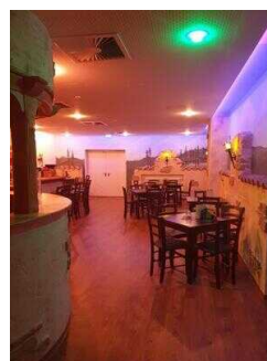
UG: Bar Excalibur