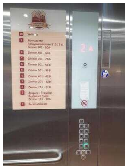
Aufzug EG – 10. OG