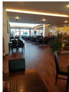
EG: Restaurant Burghof