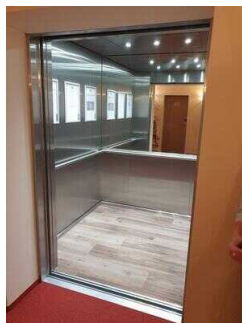
Aufzug EG – 10. OG