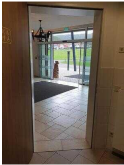
Blick auf den Hoteleingang