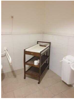
EG: Öffentliches WC für Menschen mit Behinderung im Eingangsbereich