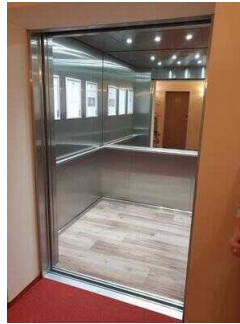
Aufzug EG – 10. OG