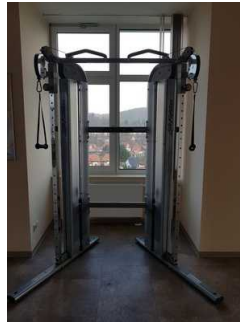
9. OG: Fitnessgerät für Rollstuhlfahrer