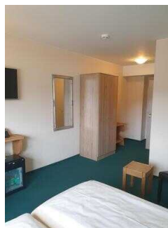
2. OG: Zimmer 201