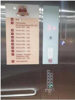
Aufzug EG – 10. OG