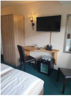
2. OG: Zimmer 209 (Schlafraum 1) Familien- Appartement