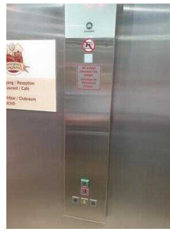
Aufzug EG – UG