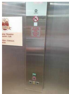
Aufzug EG – UG