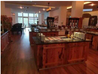
EG: Buffetts im Restaurant Burghof