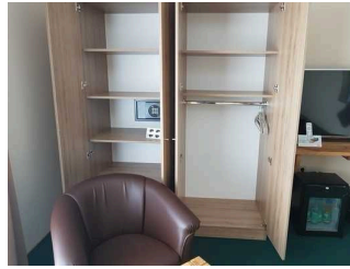
2. OG: Barrierefrei konzipiertes Zimmer 221