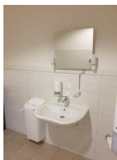
EG: Öffentliches WC für Menschen mit Behinderung im Eingangsbereich