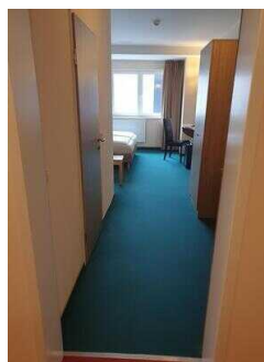
2. OG: Zimmer 201