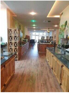
EG: Buffetts im Restaurant Burghof