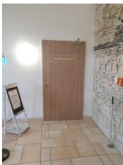
EG: Burg-Café (Zugang über Restaurant Burghof)