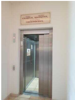
Aufzug EG – UG