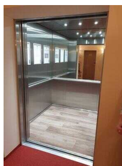
Aufzug EG – 10. OG