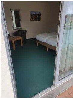
2. OG: Barrierefrei konzipiertes Zimmer 221