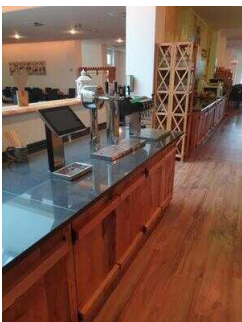
EG: Buffetts im Restaurant Burghof