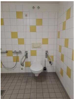
Bad im Zimmer Nr. 1