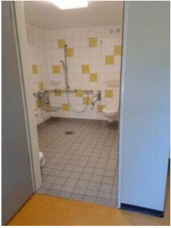
Bad im Zimmer Nr. 1