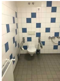
Bad im Zimmer Nr. 2