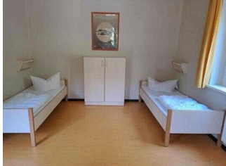
Zimmer Nr. 1