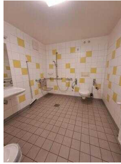
Bad im Zimmer Nr. 1