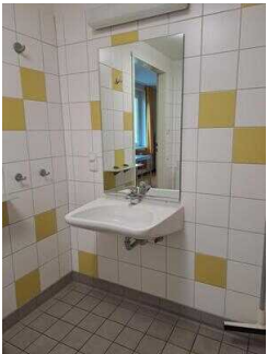
Bad im Zimmer Nr. 1