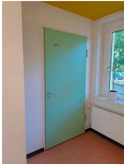
Zimmer Nr. 1