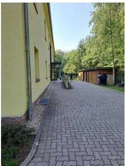
Nebeneingang mit Rampe