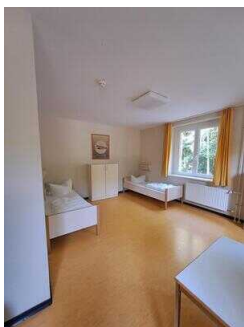
Zimmer Nr. 1