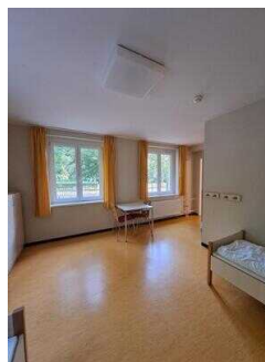
Zimmer Nr. 1