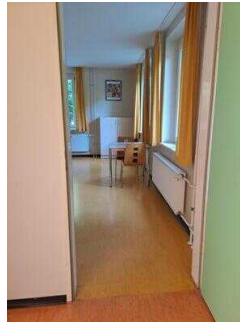
Zimmer Nr. 1