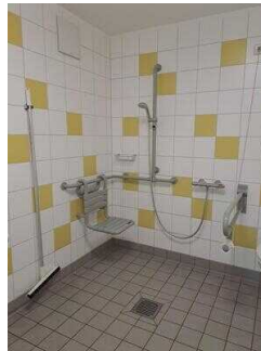
Bad im Zimmer Nr. 1