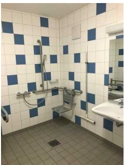
Bad im Zimmer Nr. 2