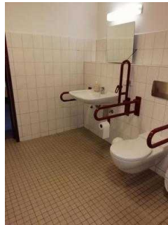
Sanitärraum Zimmer 05 und 03