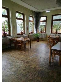
Frühstücks- und Speiseraum