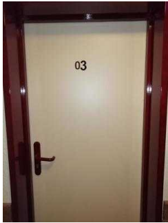
Tür von Zimmer 05 und 03 (baugleich)