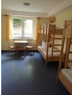
Zimmer 05 und 03 (baugleich)