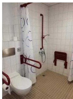
Sanitärraum Zimmer 05 und 03