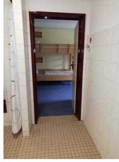
Zimmer 05 und 03 (baugleich)