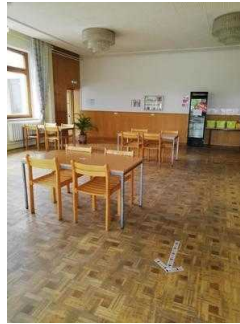
Frühstücks- und Speiseraum