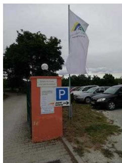
Parkplatz außerhalb des Objekts