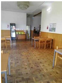
Frühstücks- und Speiseraum