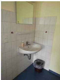
Zimmer 05 und 03 (baugleich)