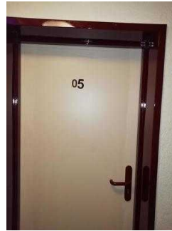
Tür von Zimmer 05 und 03 (baugleich)