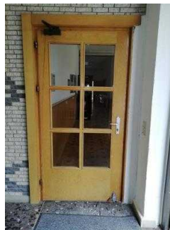
Tür zu Frühstücks- und Speiseraum