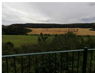
Blick ins Saaletal von der Terrasse Jugendherberge Nebra