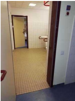
Sanitärraum Zimmer 05 und 03