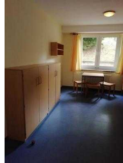
Zimmer 05 und 03 (baugleich)