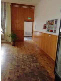
Frühstücks- und Speiseraum