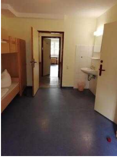
Zimmer 05 und 03 (baugleich)