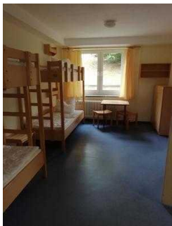
Zimmer 05 und 03 (baugleich)