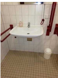
Sanitärraum Zimmer 05 und 03