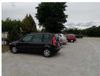
Parkplatz außerhalb des Objekts