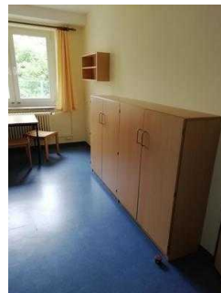
Zimmer 05 und 03 (baugleich)