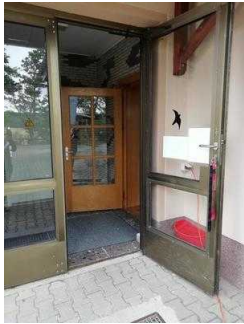
Frühstücks- und Speiseraum