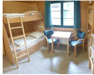
Bungalow 16 und 17 (baugleich): Schlafräum