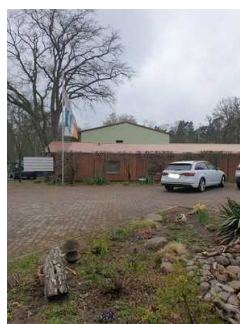
Parkplatz an der Rezeption