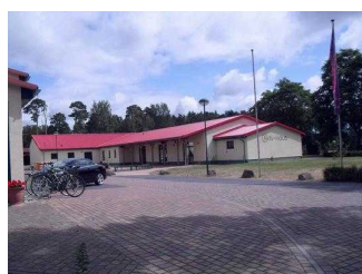
Kinder- und Jugenderholungszentrum (KiEZ) Arendsee/ Altmark