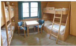
Bungalow 16 und 17 (baugleich): Schlafräum