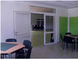
Turmhaus: Veranstaltungsraum Tür