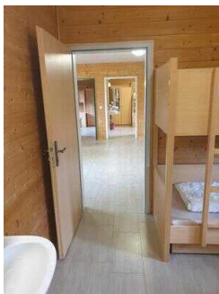
Bungalow 16 und 17 (baugleich): Schlafräum