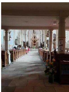
Merseburger Dom – Kirchenraum mit Ladegastorgel