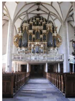
Blick auf die imposante Ladegast Orgel