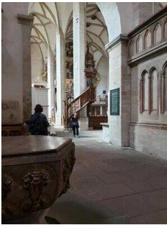
Taufkapelle mit Taufbecken im Kirchenraum Dom