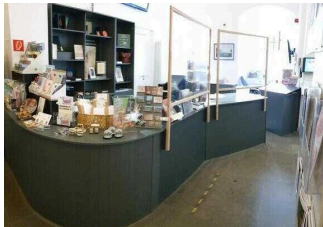
Kasse im Museumsshop