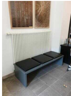
Kasse im Museumsshop