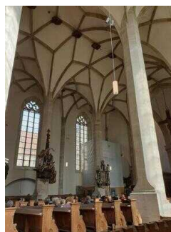
Merseburger Dom – Kirchenraum mit Ladegastorgel