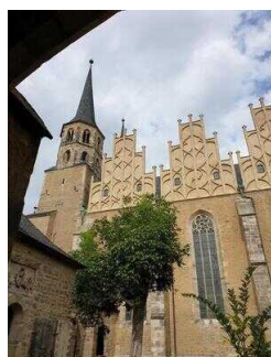
Merseburger Dom St. Johannes und St. Laurentius