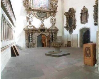
Taufkapelle mit Taufbecken im Kirchenraum Dom