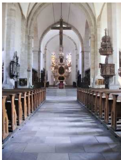
Blick aus dem Mittelgang auf die Kanzel, das Kreuz, den Altar und die farbigen Kirchenfenster.