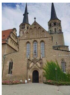
Merseburger Dom St. Johannes und St. Laurentius