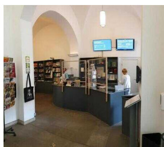
Eingang Museum mit Kasse und Shop