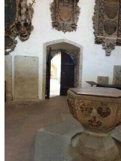
Taufkapelle mit Taufbecken im Kirchenraum Dom