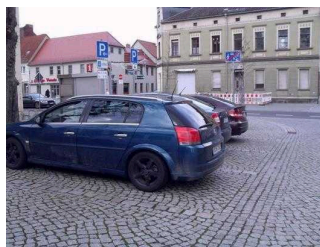
allgemeine Parkplätze direkt am Rathaus