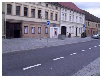
Behindertenparkplatz auf der gegenüber liegenden Straßenseite