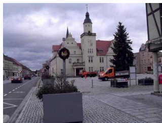
Blick von der Haltestelle zum Rathaus