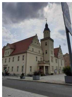
Touristinformation Coswig (Anhalt)