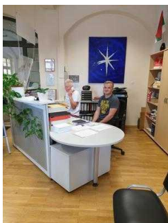
Touristinformation Coswig (Anhalt)