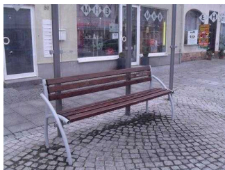
Bank an der Bushaltestelle