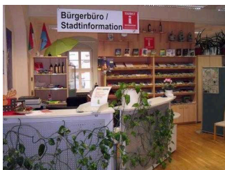
Touristinformation Coswig (Anhalt)