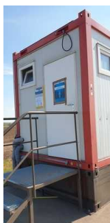
WC Wagen für Damen und Herren