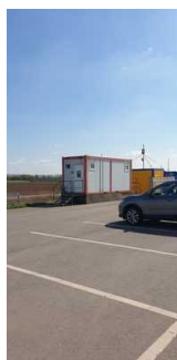
WC Wagen für Damen und Herren