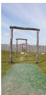
Zugang zum Ringheiligtum durch das Osttor