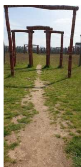
Zugang zum Ringheiligtum durch das Osttor