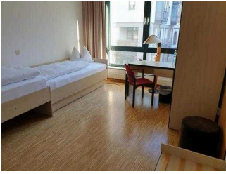
1. OG: Zimmer 101 mit Bad