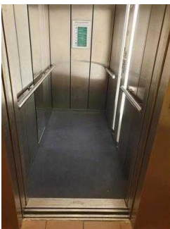
1. OG: Zimmer 101 mit Bad