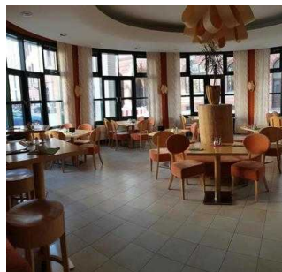
EG: 2. Frühstücksraum