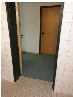
1.-4. OG: Öffentliche WCs für Menschen mit Behinderung – baugleich