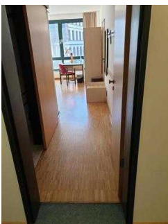
1. OG: Zimmer 101