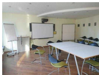
Roncalli-Haus Magdeburg – Beispiel Tagungsraum