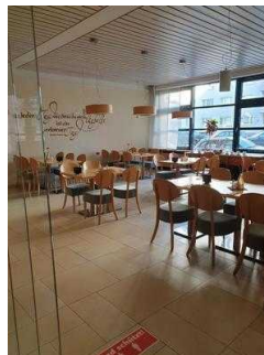
Roncalli-Haus Magdeburg – Frühstücksraum