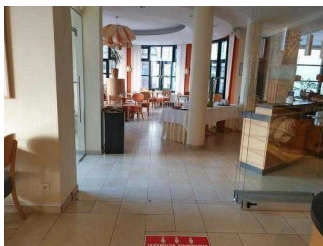
EG: Durchgang zum 2. Raum