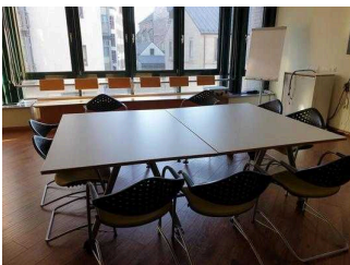
2. OG: Tagungsraum Ideengarten