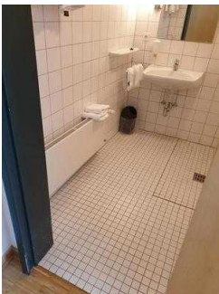
1. OG: Zimmer 101 mit Bad