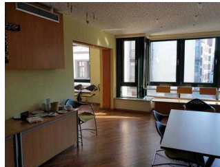
2. OG: Tagungsraum Ideengarten