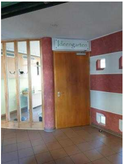
2. OG: Tagungsraum Ideengarten