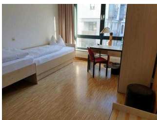
Roncalli-Haus Magdeburg – Zimmer 101