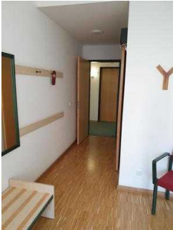
1. OG: Zimmer 101