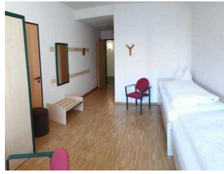
1. OG: Zimmer 101