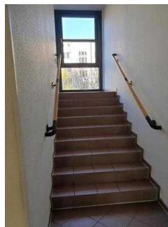
1. OG: Zimmer 101 mit Bad