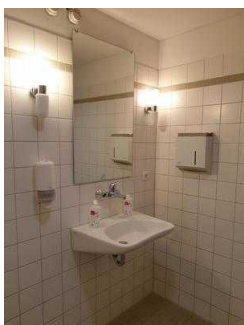
1.-4. OG: Öffentliche WCs für Menschen mit Behinderung – baugleich