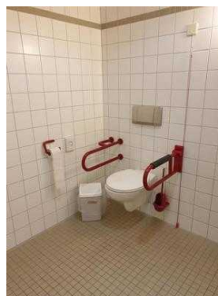
1.-4. OG: Öffentliche WCs für Menschen mit Behinderung – baugleich