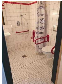
1. OG: Zimmer 101 mit Bad