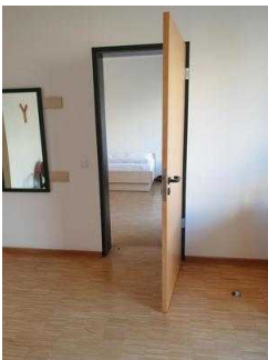
Tür zum Begleiterzimmer (EZ)