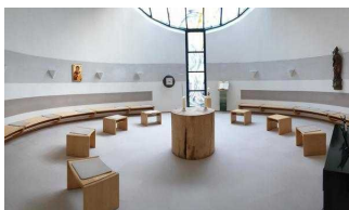
Roncalli-Haus Magdeburg – Kapelle