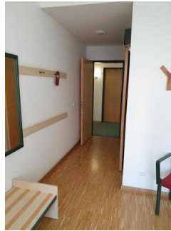
1. OG: Zimmer 101 mit Bad