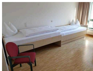
1. OG: Zimmer 101