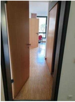
1. OG: Zimmer 112