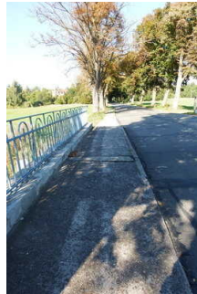
Rundwanderweg entlang der Kreisstraße