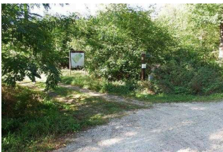
Rundwanderweg Lindau im Naturpark Fläming/Sachsen- Anhalt