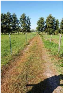
Rundwanderweg Lindau im Naturpark Fläming/Sachsen- Anhalt