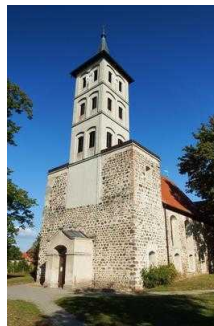
Rundwanderweg Lindau im Naturpark Fläming/Sachsen- Anhalt