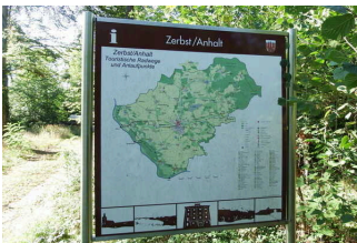
Info-Punkt des Naturparks Fläming