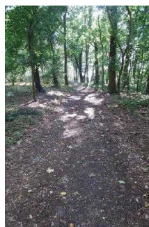
Rundwanderweg Lindau im Naturpark Fläming/Sachsen- Anhalt