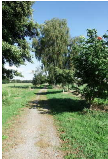
Rundwanderweg Lindau im Naturpark Fläming/Sachsen- Anhalt