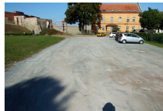
Parkplatz am Beginn