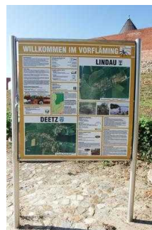
Infotafel am Rundwanderweg Lindau im Naturpark Fläming/Sachsen- Anhalt