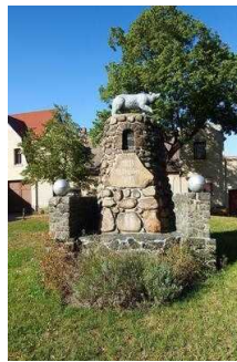
Rundwanderweg Lindau im Naturpark Fläming/Sachsen- Anhalt