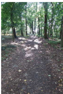
Rundwanderweg Lindau im Naturpark Fläming/Sachsen- Anhalt