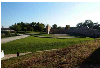
Burganlage Lindau im Naturpark Fläming/ Sachsen-Anhalt