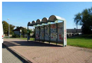
Bushaltestelle Lindau, Schule

Es gibt keine Haltestelle des öffentlichen Personennahverkehrs (ÖPNV) in max. 100m Entfernung vom Eingang/Zugang.