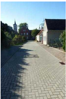
Rundwanderweg Lindau im Naturpark Fläming/Sachsen- Anhalt