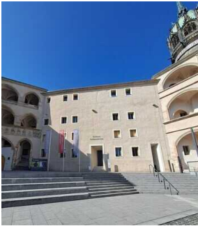
Schlosshof: Eingang zum Museum