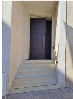
Schlosshof: Eingang zum Museum