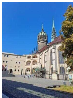
Schlosshof – Zugang zum Besucherzentrum