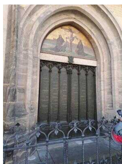
Thesentür Martin Luthers