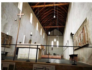
St. Wiperti Kirche Quedlinburg