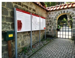
St. Wiperti Kirche Quedlinburg