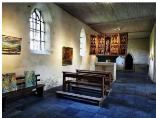
St. Wiperti Kirche Quedlinburg