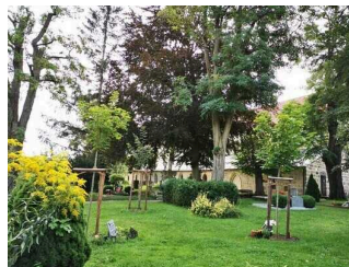
St. Wiperti Kirche Quedlinburg