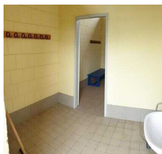
Zugang zu den Duschen