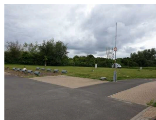
Parkplatz am Eingang