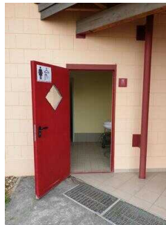
Tür zur Umkleide / Duschen