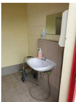
Waschbecken im Vorraum