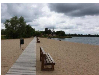
Strandbad Seepark Barby (Elbe)