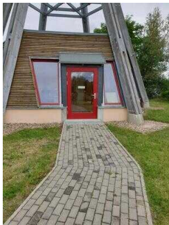
Weg vom Ausgang Infopavillon zu den Duschen/Umkleiden/ Strand