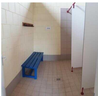
Öffentliche Duschen / Umkleiden