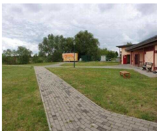
Weg zu den Duschen/ Umkleiden