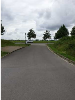
Einfahrt zum Parkplatz links im Bild