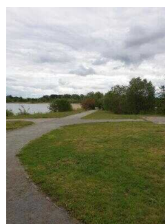
Strandbad Seepark Barby (Elbe)