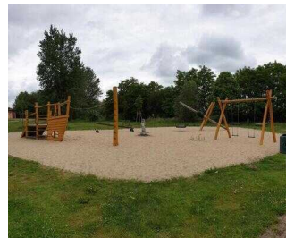
Strandbad Seepark Barby (Elbe)