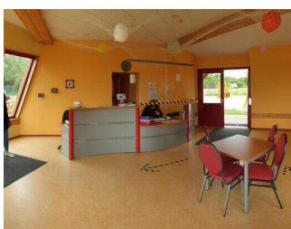
Strandbad Seepark Barby (Elbe)