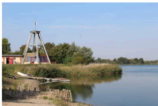
Strandbad Seepark Barby (Elbe)