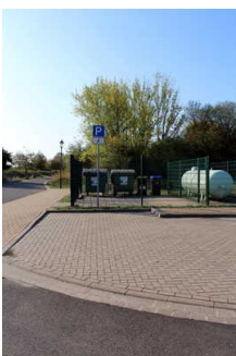
Parkplatz am Eingang