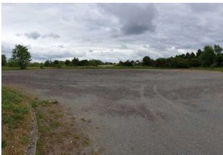
Parkplatz an der Einfahrt zum Seepark