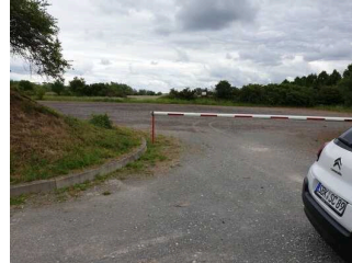
Parkplatz an der Einfahrt zum Seepark