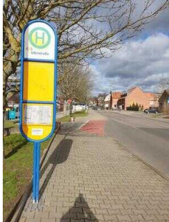
Bushaltestelle entgegengesetzte Richtung am Parkplatz