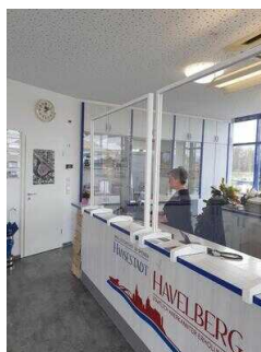
Tourist-Information Havelstadt Havelberg