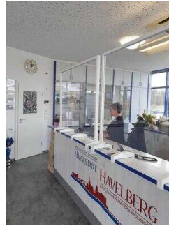
Counter mit Kasse