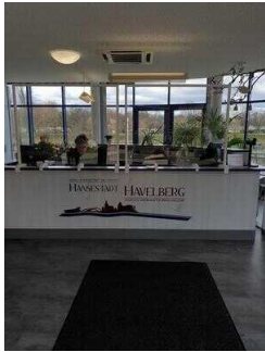
Counter mit Kasse