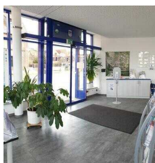
Tourist-Information Havelstadt Havelberg