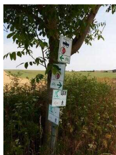
Wanderweg "Geopfad Wettin"