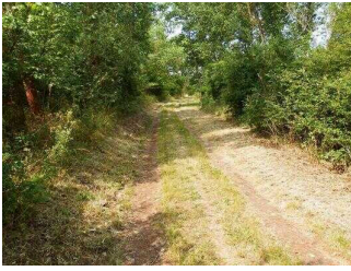
Wanderweg "Geopfad Wettin"