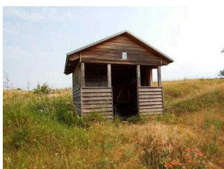
Wanderweg "Geopfad Wettin"