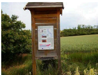
Schautafeln 1 – 10 am Wanderweg