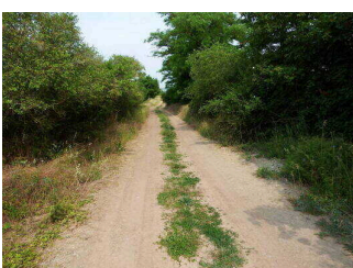
1. Abschnitt ab Jagdhütte Wettin bis Informationstafel 7 "Illauteiche"