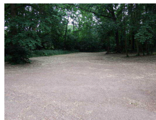
Parkplatz an der Jagdhütte Wettin

Der Parkplatz an der Jagdhütte Wettin ist der Ausgangspunkt des Geopfades. Die Parkfläche ist stark abfallend und besteht aus verdichteten Boden. Es existieren keine markierten Parkflächen. Am Parkplatz befindet sich eine Übersichtstafel für den Geopfad.