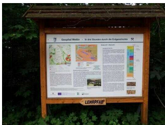
Wanderweg "Geopfad Wettin"