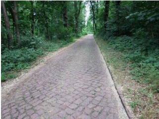
Wanderweg "Geopfad Wettin"