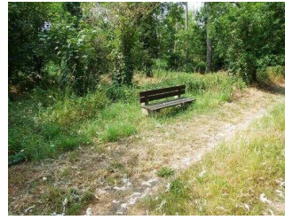
Wanderweg "Geopfad Wettin"