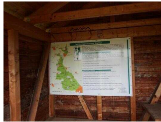
Schautafeln 1 – 10 am Wanderweg