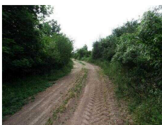
Wanderweg "Geopfad Wettin"