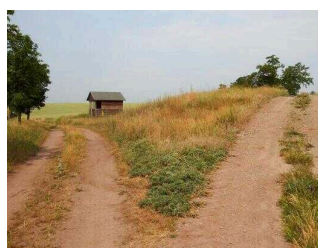
Wanderweg "Geopfad Wettin"