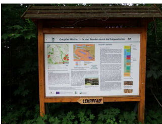
Übersichtstafel am Parkplatz an der Jagdhütte Wettin