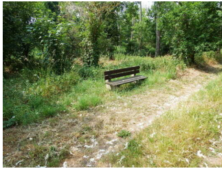
1. Abschnitt ab Jagdhütte Wettin bis Informationstafel 7 "Illauteiche"