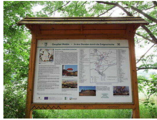
Schautafeln 1 – 10 am Wanderweg