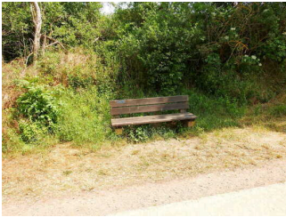
2. Abschnitt ab Ilauteiche bis Jagdhütte Wettin