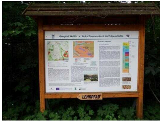
Schautafeln 1 – 10 am Wanderweg