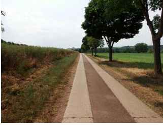
2. Abschnitt ab Ilauteiche bis Jagdhütte Wettin