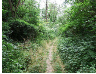
2. Abschnitt ab Ilauteiche bis Jagdhütte Wettin