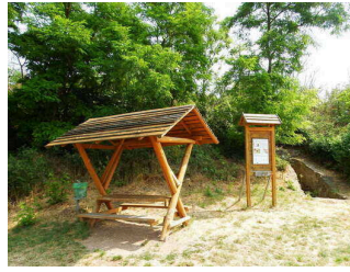
1. Abschnitt ab Jagdhütte Wettin bis Informationstafel 7 "Illauteiche"