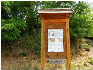
Schautafeln 1 – 10 am Wanderweg