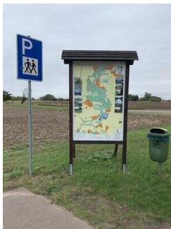
Wanderweg "Plötzkauer Auenwald"