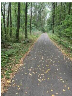
Wanderweg "Plötzkauer Auenwald"