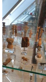
2. OG: Ausstellungsraum