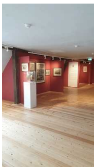
2. OG: Ausstellungsraum