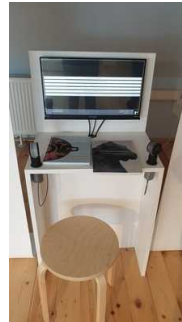
2. OG: Ausstellungsraum