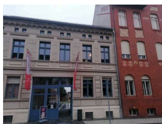
Winckelmann– Museum Stendal