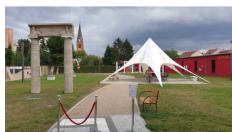
Winckelmann– Museum Stendal