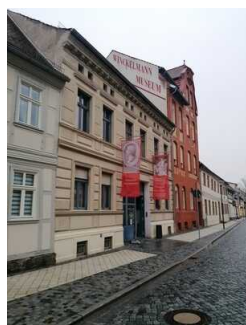
Winckelmann– Museum Stendal