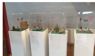
2. OG: Ausstellungsraum