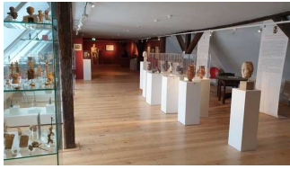
2. OG: Ausstellungsraum