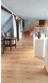
2. OG: Ausstellungsraum