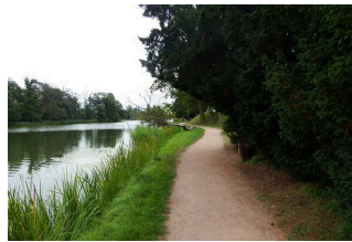
Hauptwege durch den Park