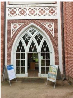
Eingang Gotisches Haus