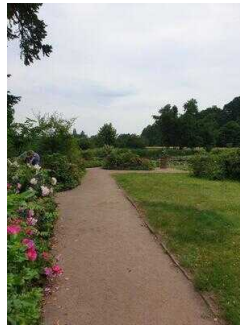
Hauptwege durch den Park