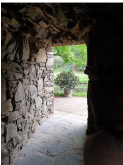
Felsengrotte, Insel Stein