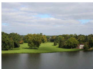
Blick vom Belvedere des Schlosses in Schochs Garten