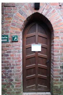
Gotisches Haus: Öffentliches WC