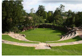
Antikes Theater auf der Insel Stein