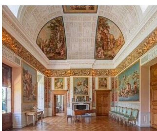
Wörlitzer Park im Gartenreich Dessau- Wörlitz