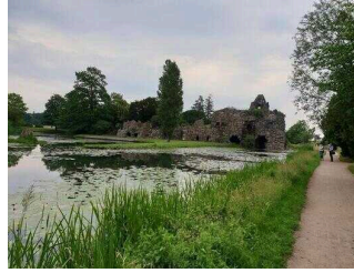
Hauptwege durch den Park