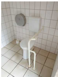
Gotisches Haus: Öffentliches WC