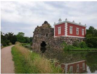
Insel Stein mit Villa Hamilton