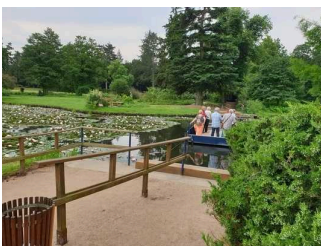
Amtsfähre zur Überquerung der Flussläufe