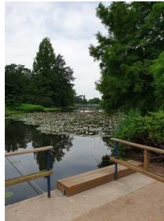
Amtsfähre zur Überquerung der Flussläufe