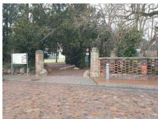
Eingang in den Park