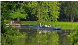
Amtsfähre zur Überquerung der Flussläufe