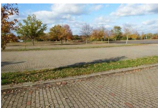
Großparkplatz in der Nähe des Gotischen Haus