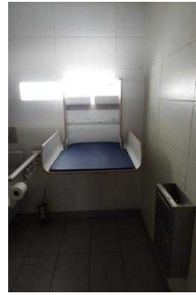
Insel Stein: Öffentliches WC für Menschen mit Behinderungen