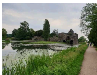
Allgemeine Informationen zum Wörlitzer Park