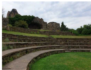
Insel Stein, antikes Theater