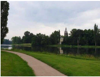
Hauptwege durch den Park