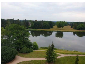
Blick in den Wörlitzer Park