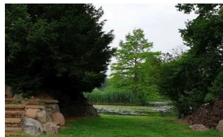
Gondelanlegestelle am Antiken Theater