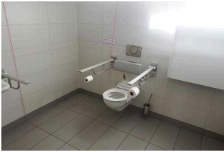
Insel Stein: Öffentliches WC für Menschen mit Behinderungen