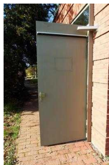
Insel Stein: Tür zum öffentlichen WC für Menschen mit Behinderungen