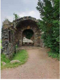
Hauptwege durch den Park