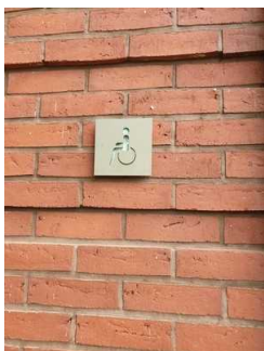
Insel Stein: Öffentliches WC für Menschen mit Behinderungen