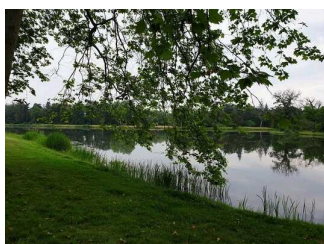
Allgemeine Informationen zum Wörlitzer Park