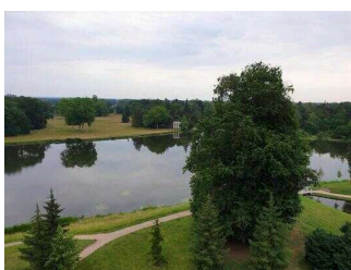
Wörlitzer Park im Gartenreich Dessau- Wörlitz