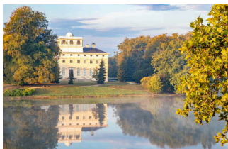
Wörlitzer Park im Gartenreich Dessau- Wörlitz