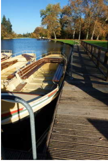
Anlegestelle der Gondeln

Die Benutzung der Gondeln ist für Menschen mit Behinderungen, speziell für Rollstuhlfahrer, nur mit Unterstützung des Personals oder von Begleitpersonen möglich. Ein niveaugleicher Zustieg ist nicht möglich!