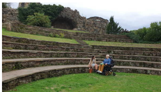
Antikes Theater auf der Insel Stein