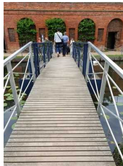
Zugang zur Insel Stein