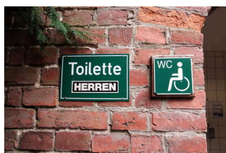
Gotisches Haus: Öffentliches WC

Anmerkungen für den Gast: Das WC befindet sich außerhalb des Gebäudes, versteckt hinter Büschen.