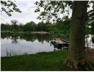
Amtsfähre zur Überquerung der Flussläufe