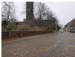
Weg vom Parkplatz zum Eingang in den Park