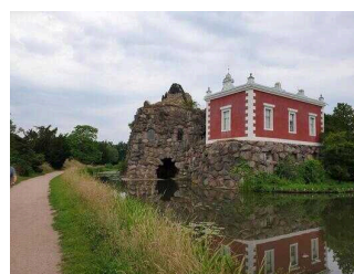
Villa Hamilton auf der Insel Stein