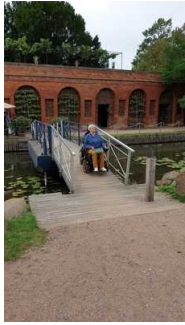
Brücke zum antiken Theater durch die Grotten