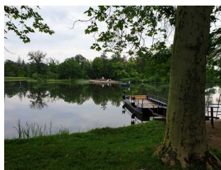
Fähranleger im Wörlitzer Park