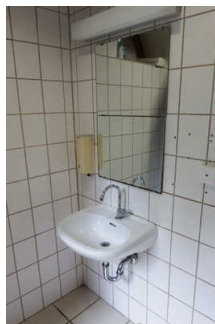
Gotisches Haus: Öffentliches WC