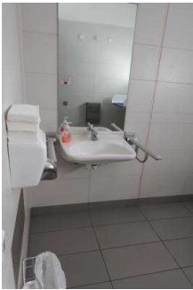
Insel Stein: Öffentliches WC für Menschen mit Behinderungen