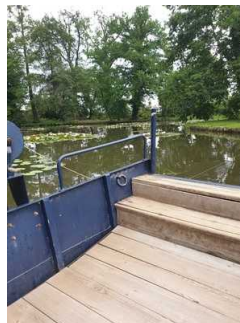
Amtsfähre zur Überquerung der Flussläufe