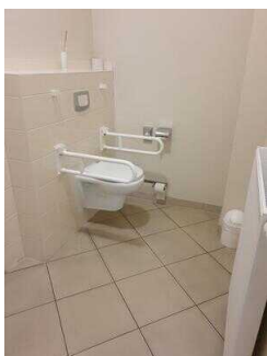
1. OG: Öffentliches WC für Menschen mit Behinderung