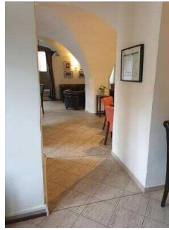
Durchgang zum Tresen