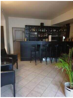
EG: Barbereich an der Lobby