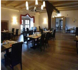
1. OG: Frühstücksraum