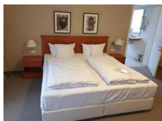
Wyndham Garden Quedlinburg Stadtschloss Hotel