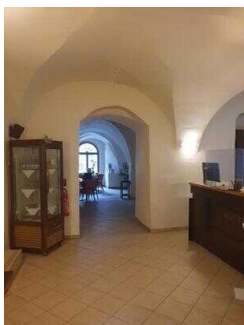
Durchgang zum Barbereich