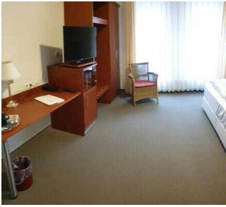
Zimmerflügel Klink, EG: Barrierefrei konzipiertes Zimmer 103