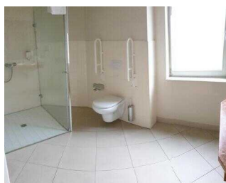
Wyndham Garden Quedlinburg Stadtschloss Hotel