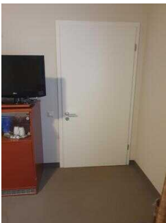
Zimmerflügel Klink, EG: Bad im Zimmer 104