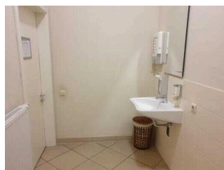
1. OG: Öffentliches WC für Menschen mit Behinderung