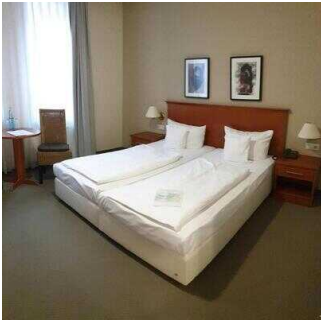
Zimmerflügel Klink, EG: Barrierefrei konzipiertes Zimmer 104