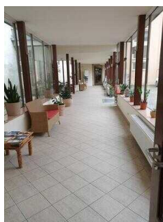
Wyndham Garden Quedlinburg Stadtschloss Hotel