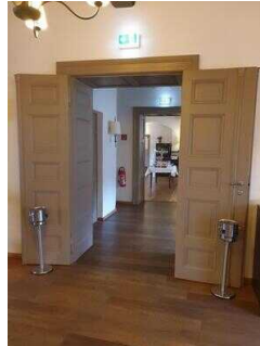
1. OG: Frühstücksraum