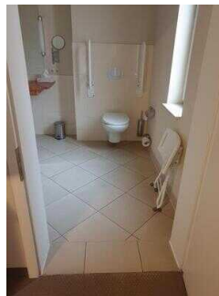
Zimmerflügel Klink, EG: Bad im Zimmer 104