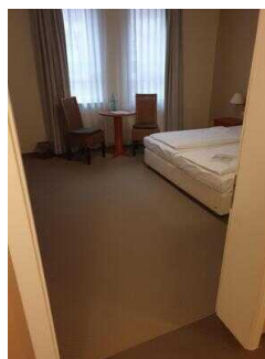
Zimmerflügel Klink, EG: Barrierefrei konzipiertes Zimmer 104