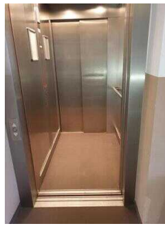
Aufzug 2 im Zimmerflügel Klink (EG-DG)