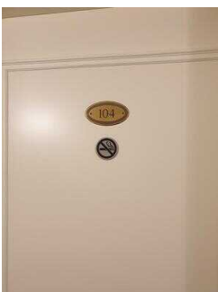
Zimmerflügel Klink, EG: Barrierefrei konzipiertes Zimmer 104