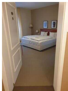
Zimmerflügel Klink, EG: Barrierefrei konzipiertes Zimmer 103