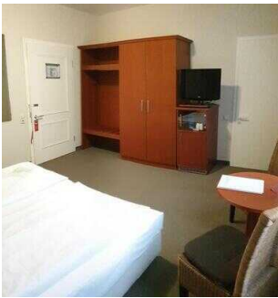
Zimmerflügel Klink, EG: Barrierefrei konzipiertes Zimmer 104