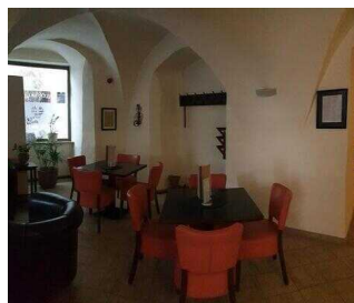
EG: Barbereich an der Lobby