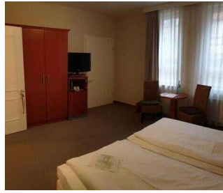
Zimmerflügel Klink, EG: Barrierefrei konzipiertes Zimmer 104