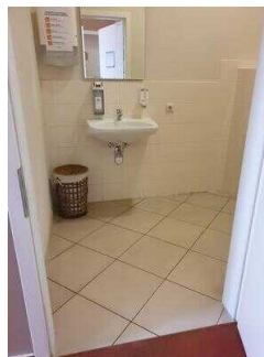
1. OG: Öffentliches WC für Menschen mit Behinderung