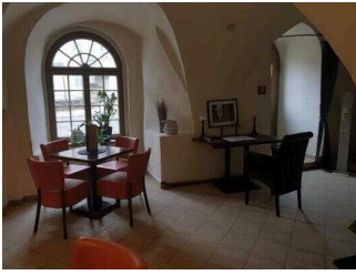
EG: Barbereich an der Lobby