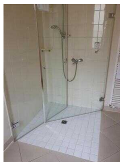
Zimmerflügel Klink, EG: Bad im Zimmer 104