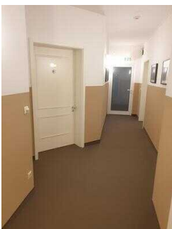
Zimmerflügel Klink, EG: Barrierefrei konzipiertes Zimmer 103