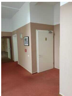
1. OG: Öffentliches WC für Menschen mit Behinderung