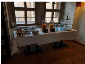
1. OG: Frühstücksraum