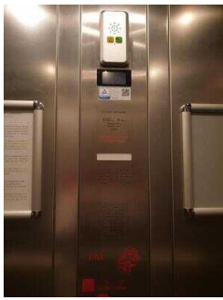
Aufzug 2 im Zimmerflügel Klink (EG-DG)