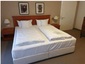
Zimmerflügel Klink, EG: Barrierefrei konzipiertes Zimmer 103