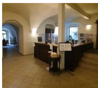
Wyndham Garden Quedlinburg Stadtschloss Hotel