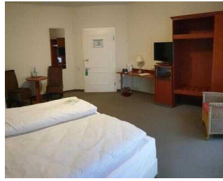
Zimmerflügel Klink, EG: Barrierefrei konzipiertes Zimmer 103