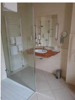
Zimmerflügel Klink, EG: Bad im Zimmer 104