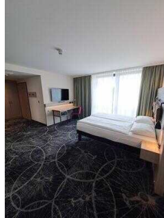
3. OG: Barrierefrei konzipiertes Zimmer Nr. 337