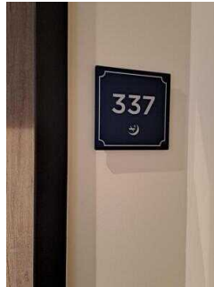
3. OG: Barrierefrei konzipiertes Zimmer Nr. 337