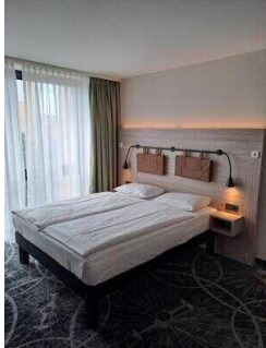
3. OG: Barrierefrei konzipiertes Zimmer Nr. 337