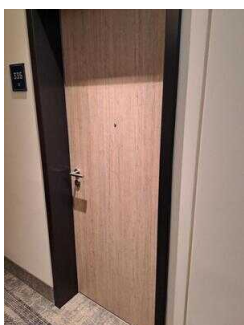
3. OG: Familienzimmer Nr. 335