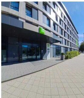
ibis Styles Magdeburg