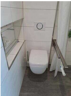
3. OG: Bad im Zimmer Nr. 337