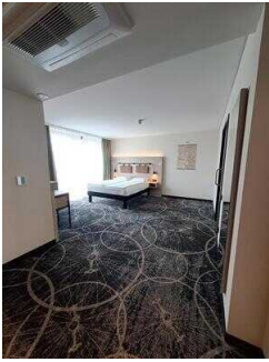
ibis Styles Magdeburg