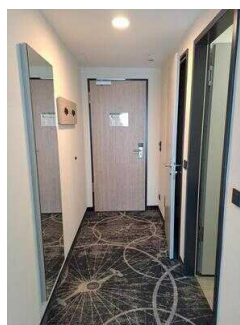
3. OG: Familienzimmer Nr. 335