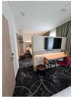
3. OG: Familienzimmer Nr. 335