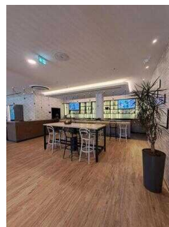
Lobby mit Barbereich