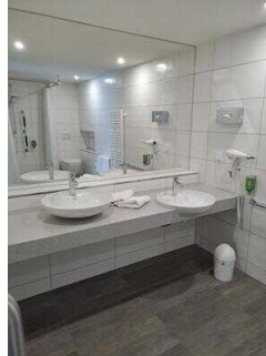
3. OG: Bad im Zimmer Nr. 337