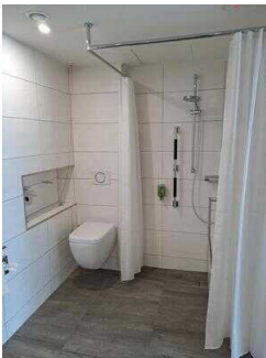
3. OG: Bad im Zimmer Nr. 337