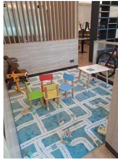
ibis Styles Magdeburg