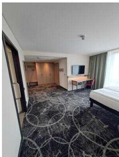
3. OG: Barrierefrei konzipiertes Zimmer Nr. 337