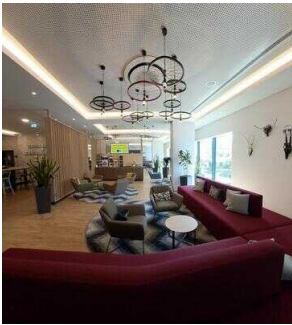
ibis Styles Magdeburg