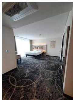
3. OG: Barrierefrei konzipiertes Zimmer Nr. 337