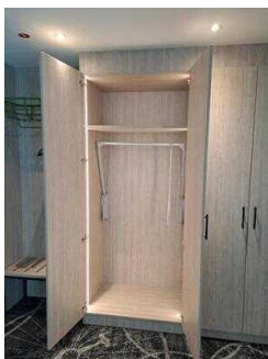
3. OG: Barrierefrei konzipiertes Zimmer Nr. 337