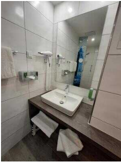
Waschbecken im Duschraum