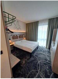
3. OG: Familienzimmer Nr. 335