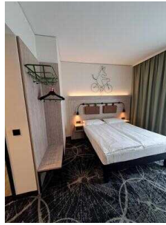
3. OG: Familienzimmer Nr. 335