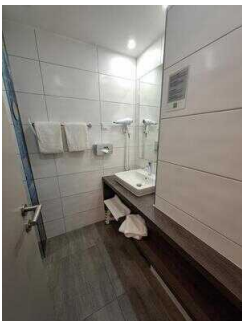
Duschraum mit Waschbecken