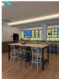
ibis Styles Magdeburg