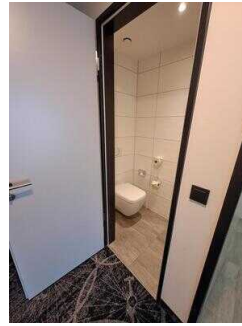
Tür zum WC