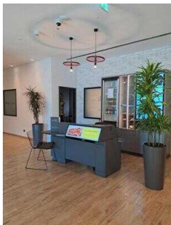
ibis Styles Magdeburg