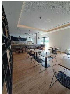
ibis Styles Magdeburg