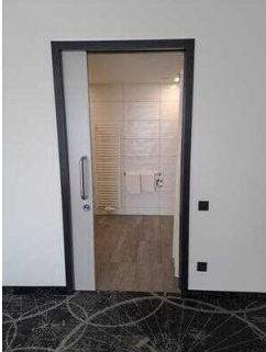
3. OG: Bad im Zimmer Nr. 337