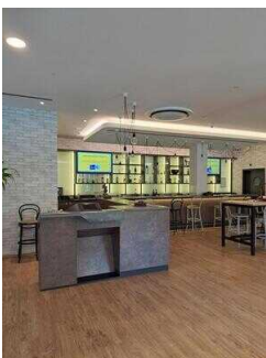
Lobby mit Barbereich