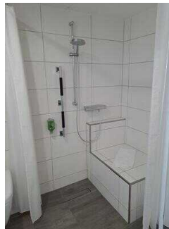
3. OG: Bad im Zimmer Nr. 337