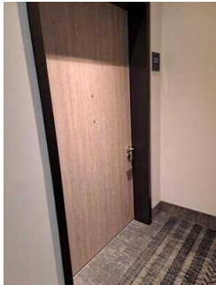
3. OG: Barrierefrei konzipiertes Zimmer Nr. 337