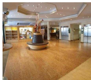
martas Hotel Lutherstadt Wittenberg