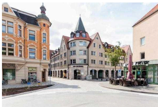
martas Hotel Lutherstadt Wittenberg