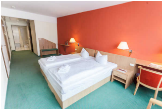
Zimmer 101 Kerstin Klupsch