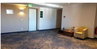
Bewegungsfläche vor dem Aufzug in den oberen Etagen