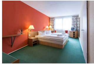
Zimmer 101 Kerstin Klupsch