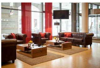
martas Hotel Lutherstadt Wittenberg