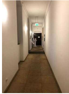
Flur von beiden Eingängen zur Gartenreich Information