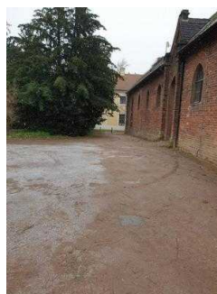
Weg vom Parkeingang zur Gartenreich Information im Küchengebäude (Kirchhofseite)