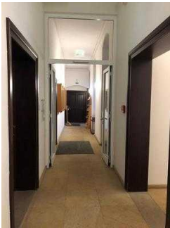
Flur von beiden Eingängen zur Gartenreich Information