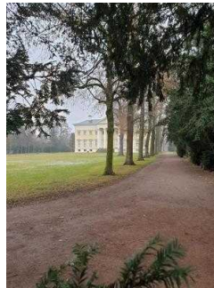
Eingang zur Gartenreich Information (Schlosseite)