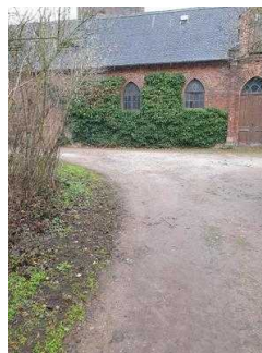
Weg vom Parkeingang zur Gartenreich Information im Küchengebäude (Kirchhofseite)