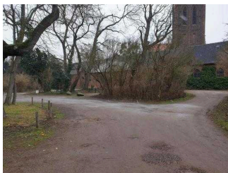
Weg vom Parkeingang zur Gartenreich Information im Küchengebäude (Kirchhofseite)