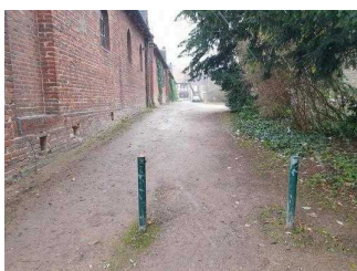
Weg vom Parkeingang zur Gartenreich Information im Küchengebäude (Kirchhofseite)