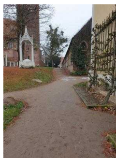
Weg vom Parkeingang zur Gartenreich Information im Küchengebäude (Kirchhofseite)