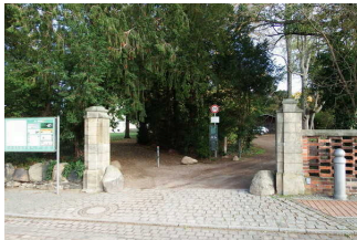
Parkeingang an der Kirchgasse

Anmerkungen für den Gast: Der Eingang des Parkes an der Kirchgasse ist nicht besonders gekennzeichnet, aber aus der Umgebung herausragend und nicht zu verfehlen.