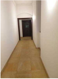
Flur von beiden Eingängen zur Gartenreich Information