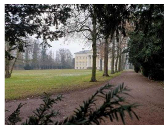
Gartenreich Information im Wörlitzer Park