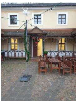
Gartenreich Information im Wörlitzer Park