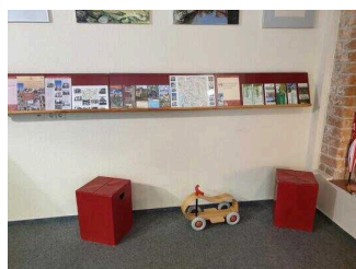
Tourist-Information Hansestadt Salzwedel