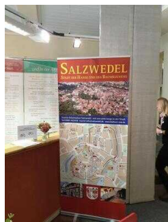
Tourist-Information Hansestadt Salzwedel