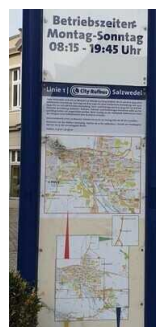
Haltestelle für Rufbus