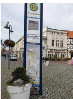
Haltestelle für Rufbus