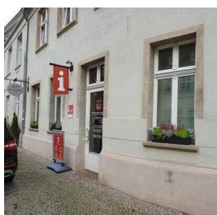
Tourist-Information Hansestadt Salzwedel