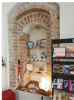
Tourist-Information Hansestadt Salzwedel