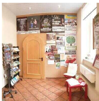
Tourist-Information Hansestadt Salzwedel