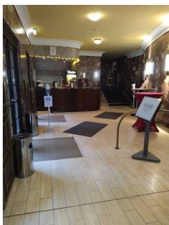
Weg Foyer zu Saal