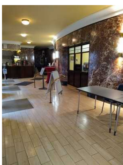
Weg Foyer zu Saal