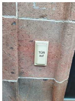
Eingangsbereich Theater Zeitz im Capitol (Türöffner)