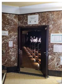
Weg Foyer zu Saal