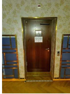
Weg Saal zu WC