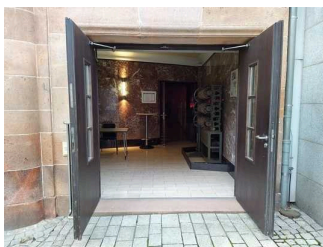
Eingangsbereich Theater Zeitz im Capitol (behindertengerechter Zugang)