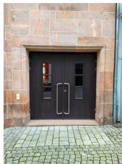
Eingangsbereich Theater Zeitz im Capitol (behindertengerechter Zugang)