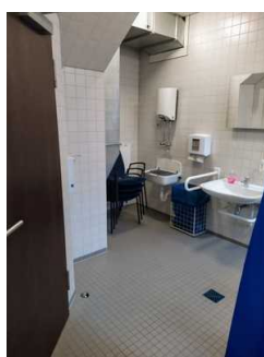
Öffentliches WC (Blick von WC-Tür zu Waschbecken)