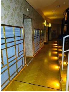
Weg Saal zu WC