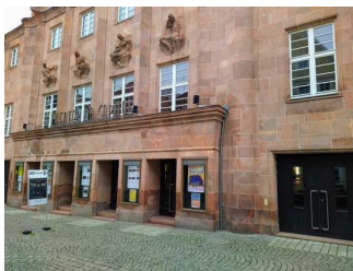
Eingangsbereich Theater Zeitz im Capitol