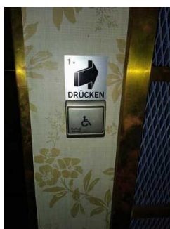
Öffentliches WC (Türöffner)