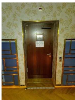
Öffentliches WC (Tür)