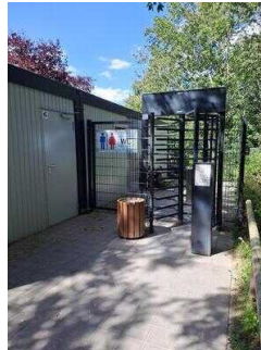
Drehkreuz mit Kassenautomat für Damen- und Herren WC