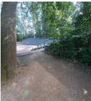
Weg zum stufenlosen Zugang Reihe 4