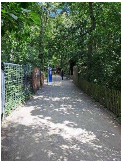
Weg vom Drehkreuz Eingang Heimattiergarten zur Kasse