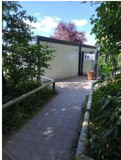
Weg zum WC