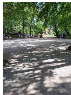
Weg durch den Heimattiergarten Bierer Berg