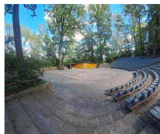
Amphitheater Bierer Berg – Schönebecker Operettensommer