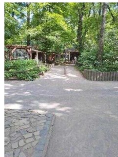
Weg vom Drehkreuz Eingang Heimattiergarten zur Kasse