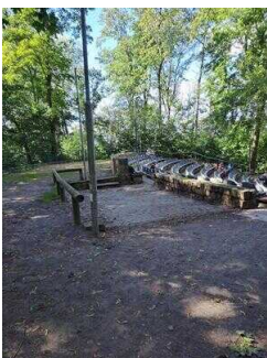
Stellflächen für RollstuhlfahrerInnen