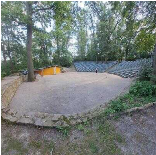
Zuschauerränge im Amphitheater