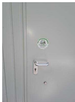
WC für Menschen mit Behinderungen