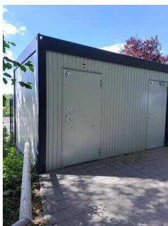
WC für Menschen mit Behinderungen