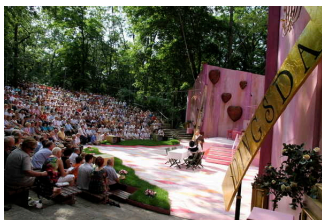
Amphitheater Bierer Berg