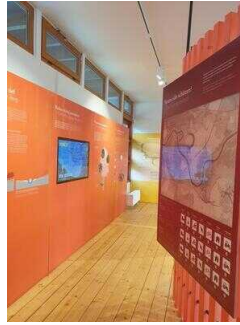
Weg durch den Ausstellungsraum