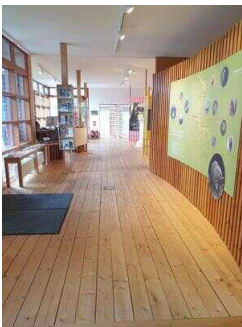
Weg vom Eingang zum Multimediaraum