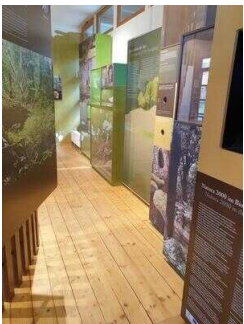
Weg durch den Ausstellungsraum