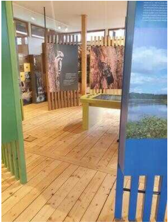
Weg durch den Ausstellungsraum