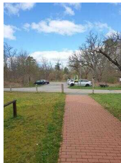
Weg vom Parkplatz zur Eingangstür Außengelände