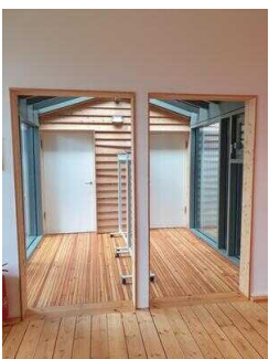
Zugang zum Multimediarraum