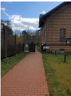
Weg vom Parkplatz zur Eingangstür Außengelände