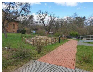
Weg von Eingangstür Außengelände zum Eingang Auenhaus