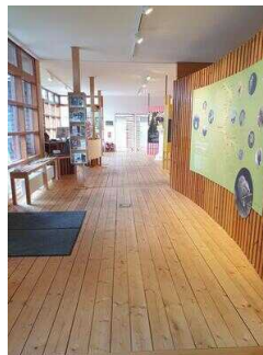
Weg durch den Ausstellungsraum