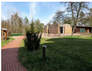
Weg von Eingangstür Außengelände zum Eingang Auenhaus