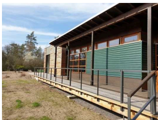
Weg von Eingangstür Außengelände zum Eingang Auenhaus