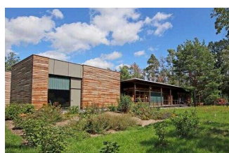
Auenhaus – Informationszentrum der Biosphärenreservatsverw Mittelelbe