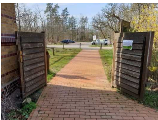
Weg vom Parkplatz zur Eingangstür Außengelände