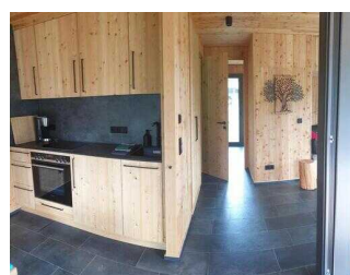
Küchenbereich und Weg zum Schlafzimmer