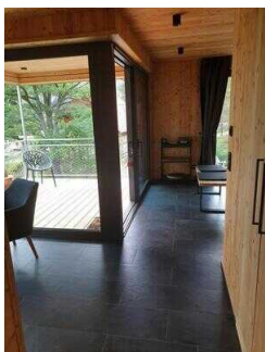
Weg im Haus