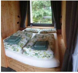
Bett links im Raum