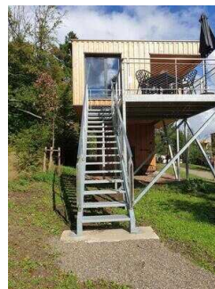
Treppe zum Eingang