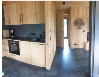
Weg im Haus