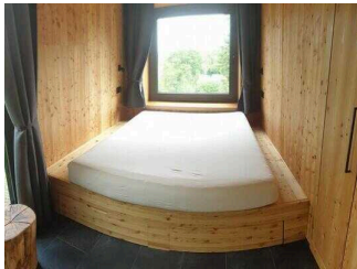
Bett rechts im Raum