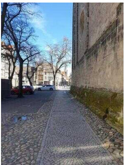
Stadtrundgang – Außenweg