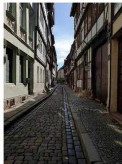
Stadtrundgang – Außenweg