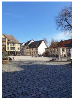
Stadtrundgang – Außenweg