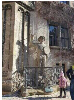
Rolandfigur am Rathaus