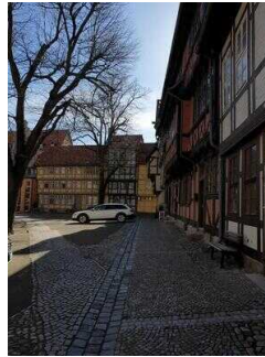
Stadtrundgang – Außenweg