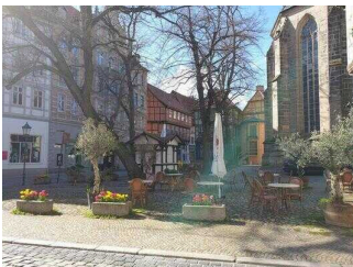
Stadtrundgang – Außenweg