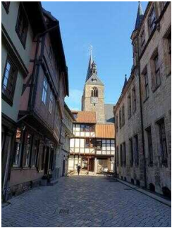
Stadtrundgang – Außenweg