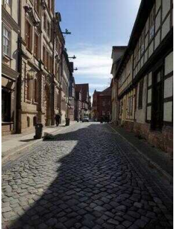
Stadtrundgang – Außenweg