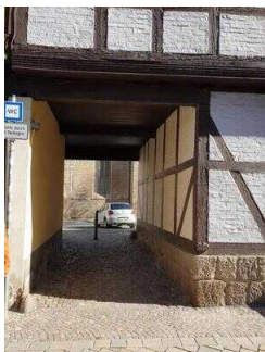
Durchgang zum Kirchhof