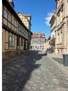
Stadtrundgang – Außenweg