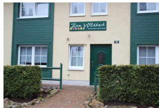
Ferienhaus mit Ferienwohnung 52