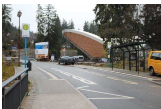
Blick auf die ÖPNV Haltestelle –sichtbare Bodenindikatoren