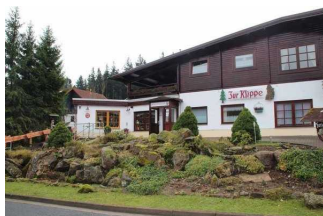
Restaurant "Zur Klippe"