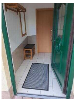
Eingang zur Ferienwohnung 52