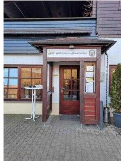
Eingang zum Restaurant "Zur Klippe"