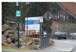
Bushaltestelle "Arena", Buslinie 264