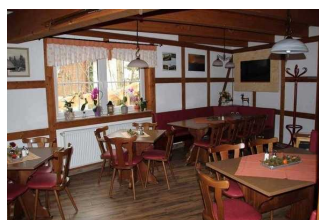
Restaurant "Zur Klippe"