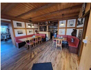
Restaurant "Zur Klippe"