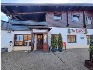
Eingang zum Restaurant "Zur Klippe"