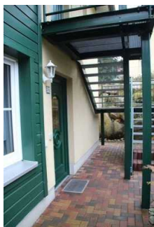
Eingang zur Ferienwohnung 52