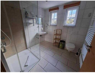
Fewo 52: Bad mit WC und Dusche