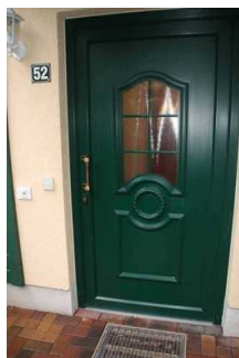
Eingang zur Ferienwohnung 52