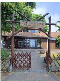
Eingang zum Außengelände