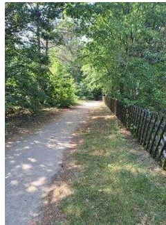
Weg vom Parkplatz/ Bushaltestelle zum Haus am See