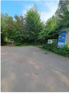
Weg vom Parkplatz/ Bushaltestelle zum Haus am See