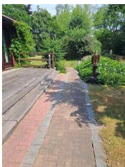
Weg vom Haupt- zum Nebeneingang