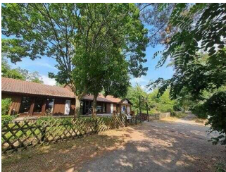
Weg vom Parkplatz/ Bushaltestelle zum Haus am See