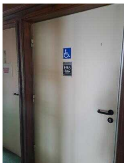
Visuell taktile Gestaltung