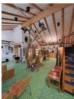
Visuell taktile Gestaltung