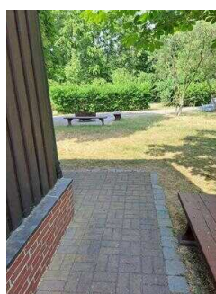
Weg vom Haupt- zum Nebeneingang