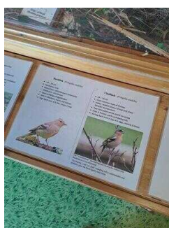
Visuell taktile Gestaltung