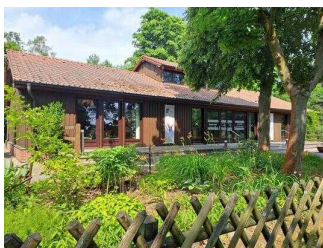
Haus am See Schlaitz – Informationszentrum für Umwelt und Naturschutz