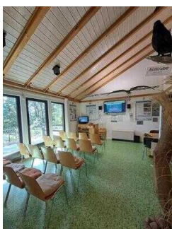
Ausstellungsraum mit Livecam in den Adlerhorst