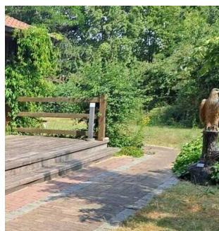
Weg vom Haupt- zum Nebeneingang