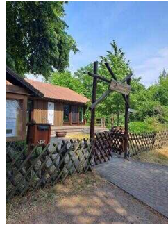
Eingang zum Außengelände