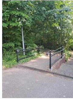
Weg vom Parkplatz/ Bushaltestelle zum Haus am See