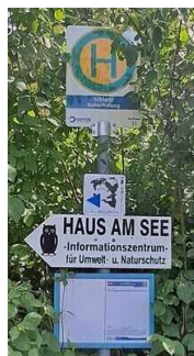
Bushaltestelle "Schlaitz Naherholung" am Parkplatz