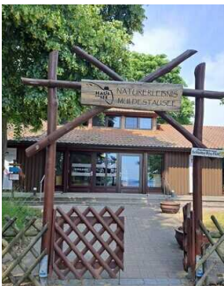
Weg vom Außeneingang zur Treppe am Eingang