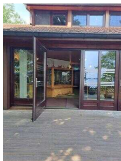
Visuell taktile Gestaltung