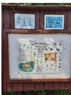
Visuell taktile Gestaltung