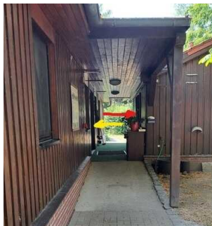
roter Pfeil: WC, gelber Pfeil: Nebeneingang