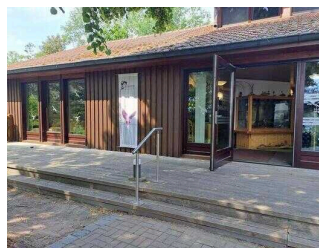
Haus am See Schlaitz – Haupteingang