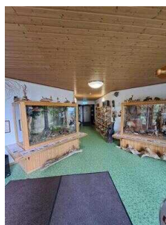
Ausstellungsvitrinen mit Blick auf den Nebeneingang