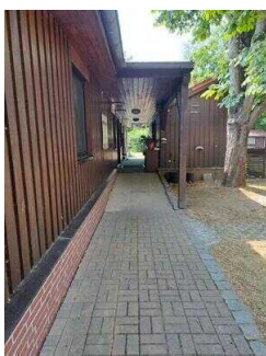
Rampe am Nebeneingang