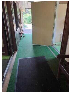
Links im Bild der stufenlose Nebeneingang