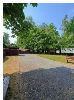
Außengelände mit Infotafeln