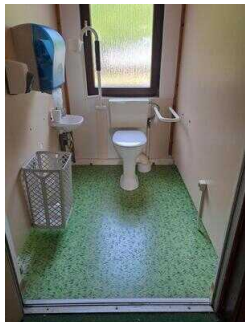
Öffentliches WC für Menschen mit Behinderung am Nebeneingang