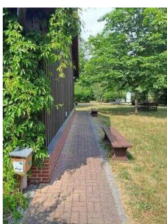
Weg vom Haupt- zum Nebeneingang