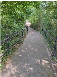
Weg vom Parkplatz/ Bushaltestelle zum Haus am See