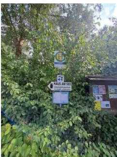
Bushaltestelle "Schlaitz Naherholung" am Parkplatz