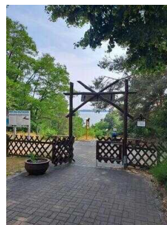
Eingang zum Außengelände