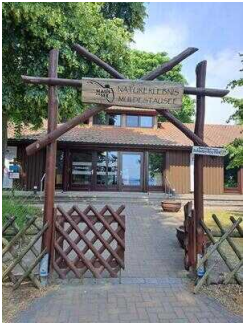
Eingang aufs Gelände