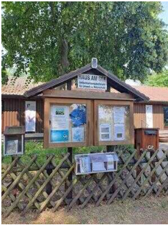
Eingang zum Außengelände