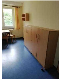
Zimmer 05 und 03 (baugleich)