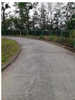
Weg außen von Rezeption zum ebenerdigen Eingang zu Zimmer 05 und 03