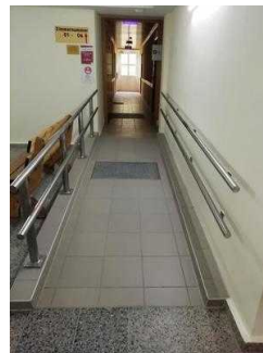
Weg von der Treppe zum Tagungsraum "Saaletal"