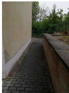
Weg außen von Rezeption zum ebenerdigen Eingang zu Zimmer 05 und 03