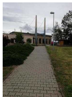
Weg von Rezeption zum Speiseraum und Tagungsraum "Hörsaal"