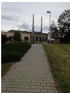
Weg von der Rezeption zum Spielplatz