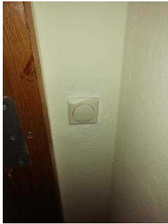
Mantelbogen visuell taktile Gestaltung