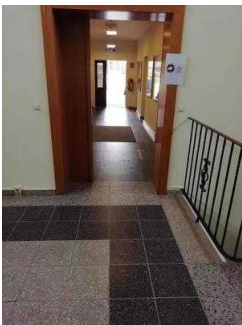
Weg von der Treppe zum Tagungsraum "Saaletal"