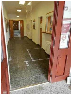
Weg von Rezeption zur Treppe ins UG mit Zimmer 05 und 03