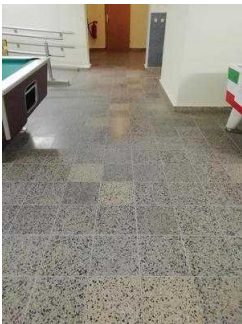
Weg von der Treppe zum Tagungsraum "Saaletal"