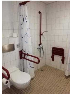
Sanitärraum Zimmer 05 und 03