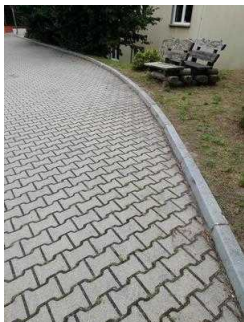
Weg außen von Rezeption zum ebenerdigen Eingang zu Zimmer 05 und 03