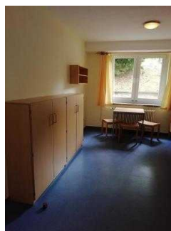
Zimmer 05 und 03 (baugleich)