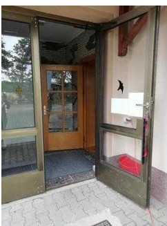
Weg von Rezeption zum Speiseraum und Tagungsraum "Hörsaal"