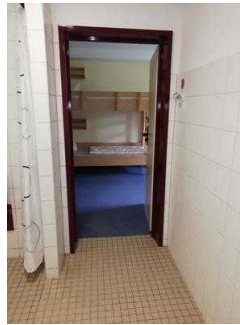
Zimmer 05 und 03 (baugleich)