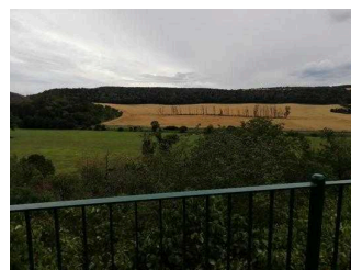
Blick ins Saaletal von der Terrasse Jugendherberge Nebra