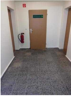
Weg zur Weinstube