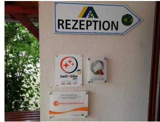
Beschilderung und Zertifikate