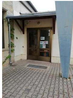
Weg von Rezeption zum Speiseraum und Tagungsraum "Hörsaal"