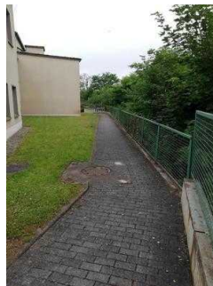
Weg außen von Rezeption zum ebenerdigen Eingang zu Zimmer 05 und 03