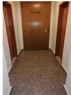
Weg von der Treppe zum Tagungsraum "Saaletal"