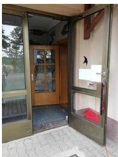
Weg von Rezeption zum Speiseraum und Tagungsraum "Hörsaal"