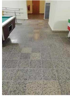
Weg zur Weinstube