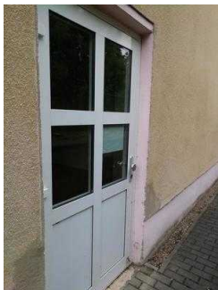
Weg außen von Rezeption zum ebenerdigen Eingang zu Zimmer 05 und 03