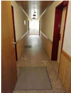
Flur von der Eingangstür zu Zimmer 05 und 03