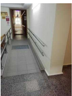
Weg von der Treppe zu Zimmer 05 und 03