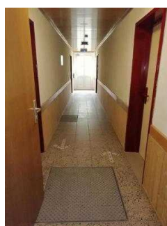
Weg von der Treppe zu Zimmer 05 und 03