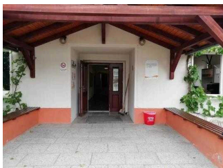
Weg von Rezeption zum Speiseraum und Tagungsraum "Hörsaal"