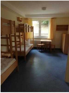
Zimmer 05 und 03 (baugleich)