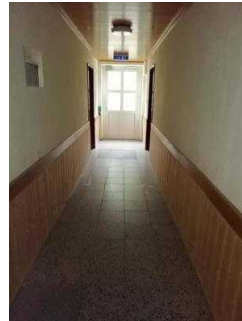
Flur von der Eingangstür zu Zimmer 05 und 03