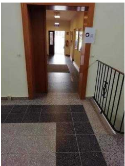
Weg von Rezeption zur Treppe ins UG mit Zimmer 05 und 03