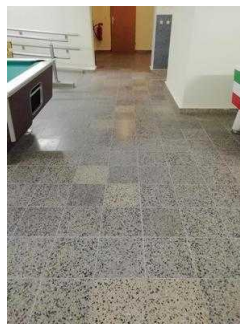
Weg von der Treppe zu Zimmer 05 und 03