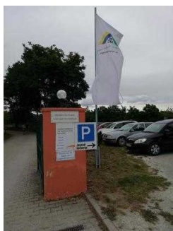
Weg vom Parkplatz zur Rezeption