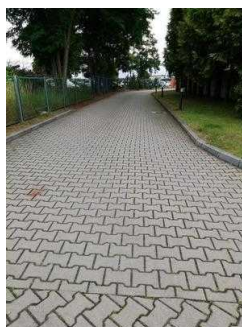
Weg vom Parkplatz zur Rezeption