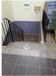
Weg von Rezeption zur Treppe ins UG mit Zimmer 05 und 03