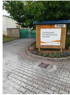
Weg vom Parkplatz zur Rezeption