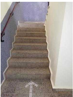
Weg von der Treppe zu Zimmer 05 und 03