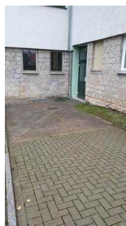
Weg außen vom Haupteingang zur Bowlingbahn und Billard-Spieleraum