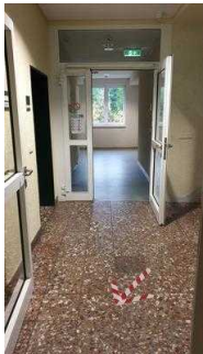
Flurtüren Richtung Seminarraum und Zimmer