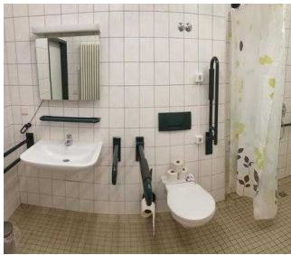
Badezimmer für Zimmer 7 und 8