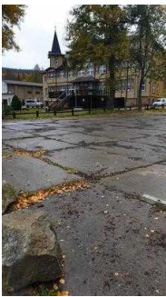
allgemeiner Parkplatz gegenüber