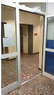
Flurtüren Richtung Seminarraum und Zimmer