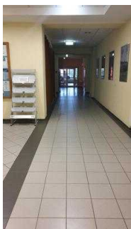
Weg von Rezeption Richtung Cafeteria, Seminarraum und zu den Zimmern 7 und 8