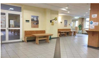
Weg von Rezeption zum Speiseraum