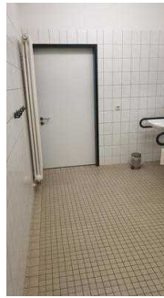
Badezimmer für Zimmer 7 und 8