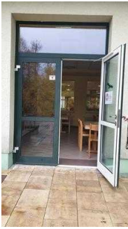
Tür zur Terrasse