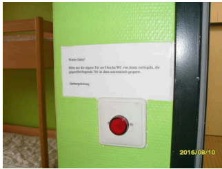
Hinweis zum Verriegeln der Tür