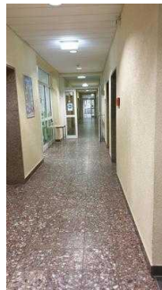
Weg von Rezeption Richtung Cafeteria, Seminarraum und zu den Zimmern 7 und 8