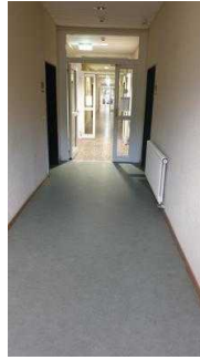
Flurtüren Richtung Seminarraum und Zimmer