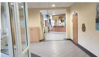
Weg vom Eingang zur Rezeption