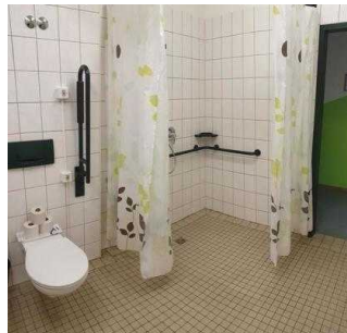
Badezimmer für Zimmer 7 und 8