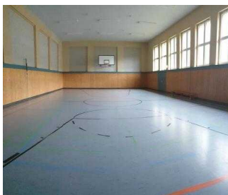
Sporthalle im Erdgeschoss