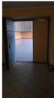
Sporthalle im Erdgeschoss