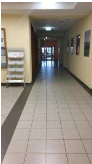
Weg von Rezeption Richtung Cafeteria, Seminarraum und zu den Zimmern 7 und 8