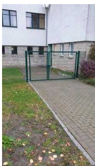
Weg außen vom Haupteingang zur Bowlingbahn und Billard-Spieleraum