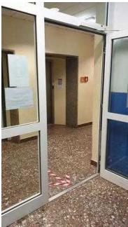
Flurtüren Richtung Seminarraum und Zimmer