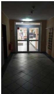
Sporthalle im Erdgeschoss