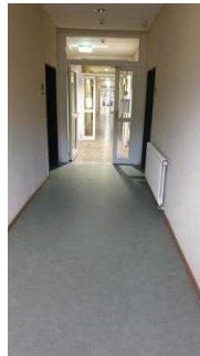
Flurtüren Richtung Seminarraum und Zimmer