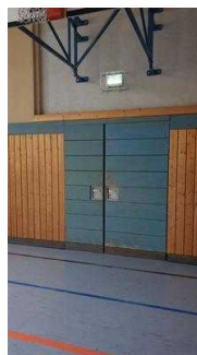
Sporthalle im Erdgeschoss