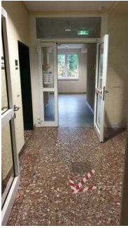
Flurtüren Richtung Seminarraum und Zimmer