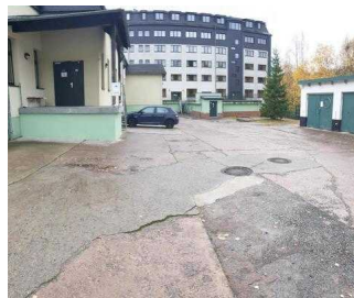
Parkplatz auf dem Hof