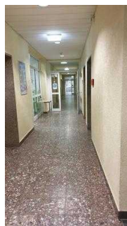
Weg von Rezeption Richtung Cafeteria, Seminarraum und zu den Zimmern 7 und 8