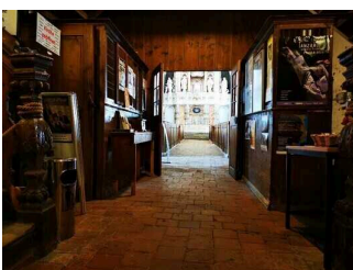
Flur vom Haupteingang zum Kircheninnenraum