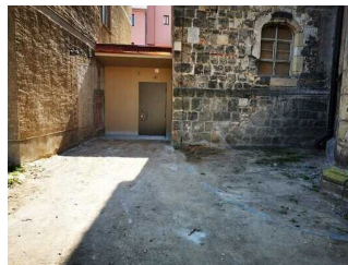
WC am Nebeneingang