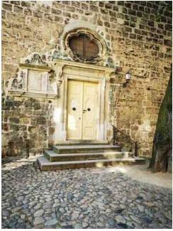
Weg vor dem Haupteingang