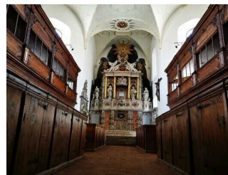
Kulturkirche St. Blasii in Quedlinburg