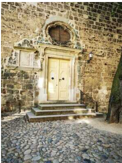
Weg vor dem Haupteingang