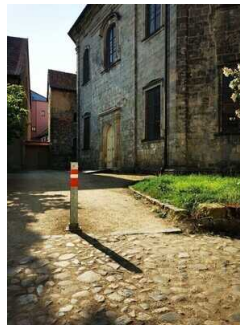
Weg zum Nebeneingang