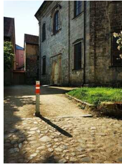
Weg zum Nebeneingang