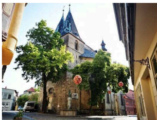
Kulturkirche St. Blasii in Quedlinburg