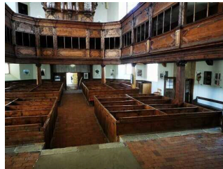
Innenraum Kirche St. Blasii