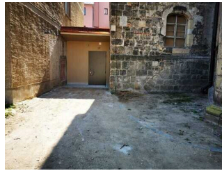
WC am Nebeneingang