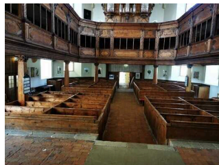
Blick vom Altar zum Ausgang