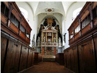
Innenraum Kirche St. Blasii