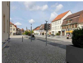
Weg von Bushaltestelle zum Eingang / Nebeneingang