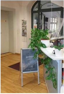
Weg vom Eingang zum Counter