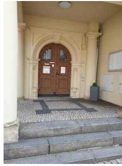
Nebeneingang für Menschen mit Behinderung