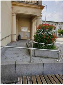
Nebeneingang für Menschen mit Behinderung