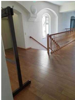
Weg im OG vom Aufzug / Treppe zum WC