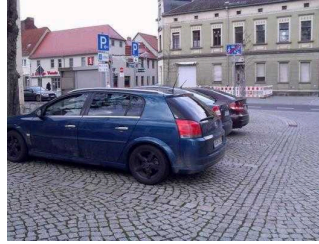
allgemeine Parkplätze direkt am Rathaus