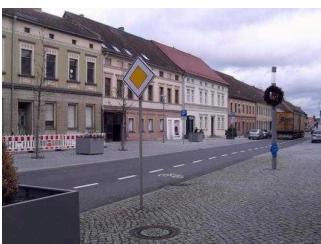
Blick auf den Parkplatz