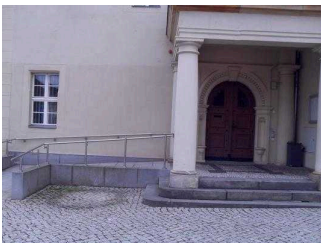
Nebeneingang mit Tür am Rathaus

Name bzw. Logo des Betriebes/der Einrichtung sind von außen nicht klar erkennbar.