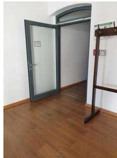
Weg im OG vom Aufzug / Treppe zum WC