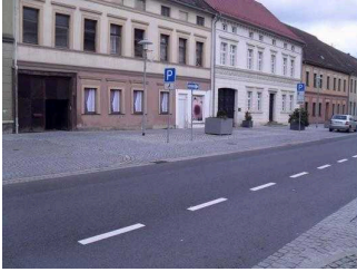
Behindertenparkplatz auf der gegenüber liegenden Straßenseite