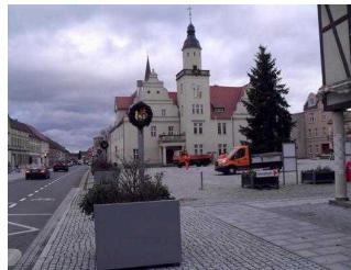
Blick von der Haltestelle zum Rathaus