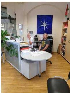
Touristinformation Coswig (Anhalt)