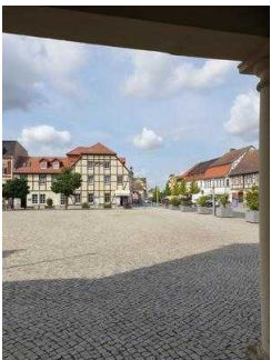
Weg von Bushaltestelle zum Eingang / Nebeneingang