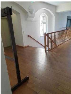
1. OG: Öffentliches WC für Menschen mit Behinderung