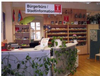
Touristinformation Coswig (Anhalt)