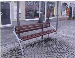
Bank an der Bushaltestelle