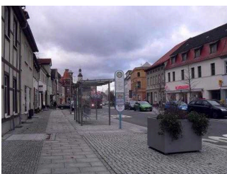
Blick auf die Haltestelle