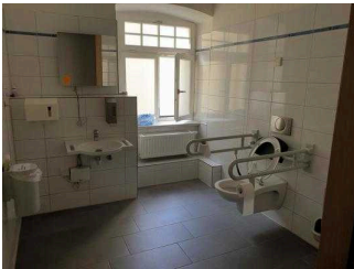
1. OG: Öffentliches WC für Menschen mit Behinderung