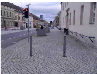
Weg vom Nebeneingang zum Parkplatz mit Poller