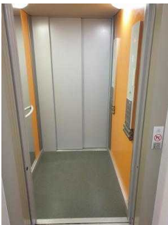
1. OG: Öffentliches WC für Menschen mit Behinderung