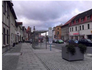
Weg von Bushaltestelle zum Eingang / Nebeneingang