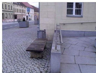
Sitzgelegenheit auf dem Weg