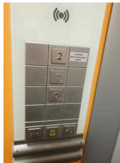
1. OG: Öffentliches WC für Menschen mit Behinderung