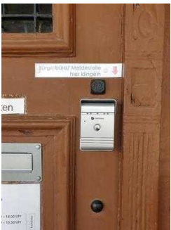
Nebeneingang für Menschen mit Behinderung