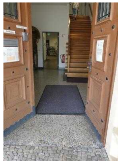
Nebeneingang für Menschen mit Behinderung