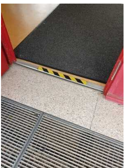
Eingang zum Strandbad durch den Infopavillon