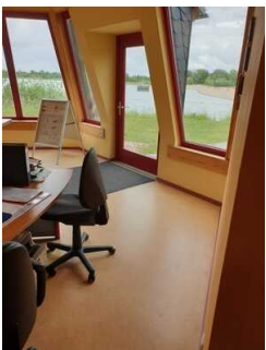
Ausgang Infopavillon / Zugang zum Seepark