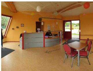
Strandbad Seepark Barby (Elbe)