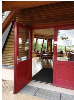
Eingang zum Strandbad durch den Infopavillon