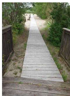
Holzbrücke Richtung Strand