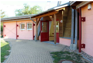
Eingangsbereich des Infopavillon