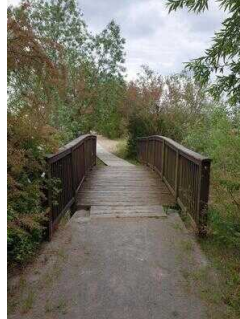
Außenweg vom Infopavillon zur Holzbrücke Richtung Strand