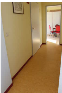
Weg von der Kasse zum WC im Infopavillon