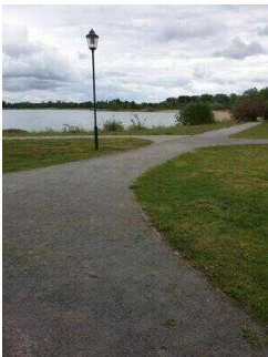
Außenweg vom Infopavillon zur Holzbrücke Richtung Strand