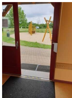
Eingang zum Strandbad durch den Infopavillon