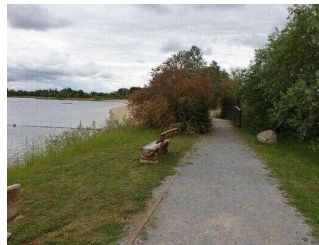
Außenweg vom Infopavillon zur Holzbrücke Richtung Strand