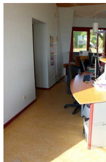
Weg von der Kasse zum WC im Infopavillon