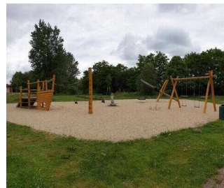
Strandbad Seepark Barby (Elbe)