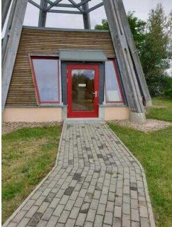
Außenweg vom Infopavillon zur Holzbrücke Richtung Strand