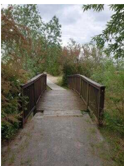
Holzbrücke Richtung Strand