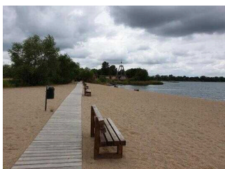
Strandbad Seepark Barby (Elbe)