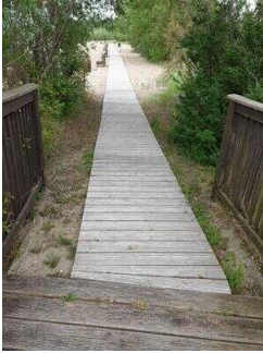
Holzbohlenweg ab Holzbrücke zum Strand