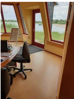
Weg um die Kasse herum zum Flur Richtung WC