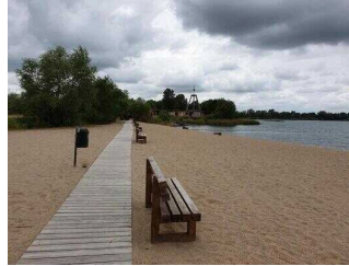
Holzbohlenweg ab Holzbrücke zum Strand