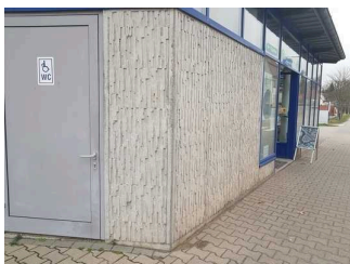
Weg außen von der Touristinformation zum öffentlichen WC