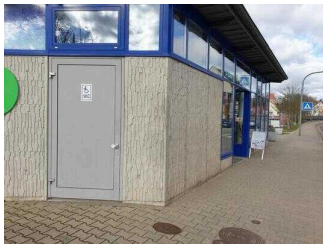
Eingang Öffentliches WC für Menschen mit Behinderung