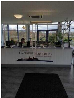
Counter mit Kasse