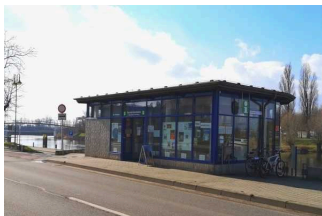
Tourist-Information Hansestadt Havelberg