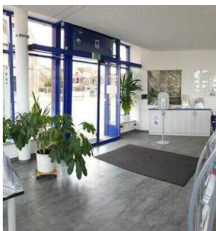
Tourist-Information Hansestadt Havelberg