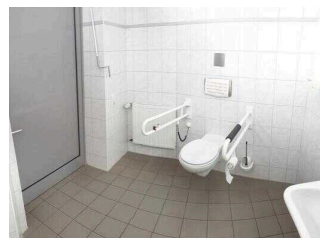
Tourist-Information Hansestadt Havelberg