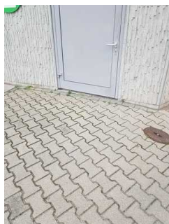
Weg außen von der Touristinformation zum öffentlichen WC