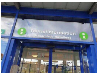
Tourist-Information Hansestadt Havelberg