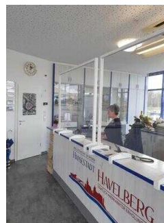
Tourist-Information Hansestadt Havelberg