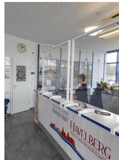
Counter mit Kasse