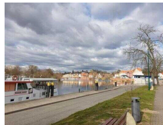
Blick auf die Havel und die Stadt