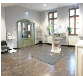
Eingang zur Tourist-Info (innen)