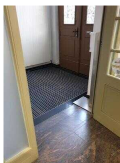
Entrance to the tourist information office (inside)