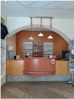
Counter in der Touristinformation