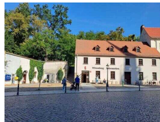
Tourist-Information Lutherstadt Wittenberg