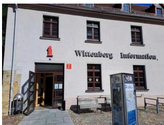
Tourist-Information Lutherstadt Wittenberg