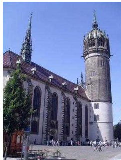
Öffentlicher Parkraum rund um die Schlosskirche vorhanden