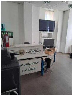
Counter im 2. Beratungsraum