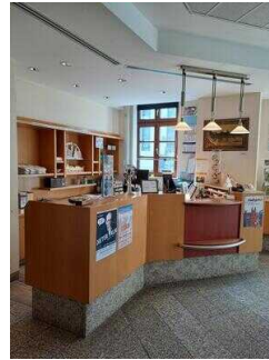
Counter in der Touristinformation