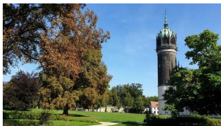
Schlosskirche Lutherstadt Wittenberg