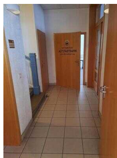
Weg vom Eingang 2. Beratungsraum