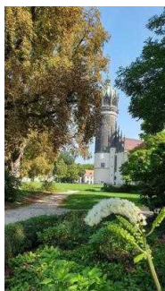
Weg vom Parkplatz zur Touristinformation