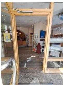
2. Eingangstür zur Touristinformation