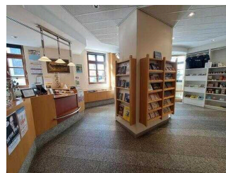
Tourist-Information Lutherstadt Wittenberg