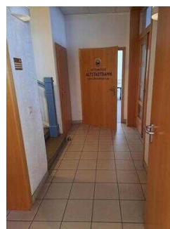
Weg vom Eingang 2. Beratungsraum