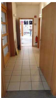
Flur zum 2. Beratungsraum