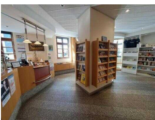
Weg vom Eingang zum Tresen / Weg zum 2. Beratungsraum